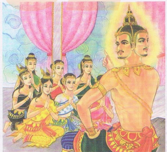
ท้าวกบิลพรหมเรียกธิดาทั้ง ๗ มาประชุม

ดังนั้นเมื่อถึงวันนี้ วันขึ้นปีใหม่แบบไทย เดิมเราก็สมมติหญิงสาวเป็นธิดาท้าวกบิลพรหม ๗ คน เพื่อเชิญเสด็จท้าวมหาพรหมออกแห่แห่นตามประเพณี กับสงน้ำผู้เฒ่าผู้แก่ซึ่งเป็น “พรหม” ของลูกหลาน เป็นธรรมเนียมสืบมา และเมื่อมีนางสงกรานต์สมมติ ๗ คน ก็ต้องมี “เคียรท้าวกบิลพรหม” นำหน้า กระบวนแห่เสมอมาจะขาดไม่ได้เช่นกันโดยการทำจำลอง ขึ้นด้วยไม้ที่ศักดิ์สิทธิ์เป็นส่วนใหญ่