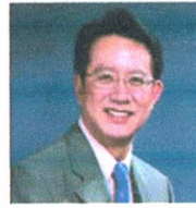
ศ.ดร.ธีรภัทร์ เสรีรังสรรค์