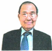
ศ.ดร.บุญทัน ดอกไธสง