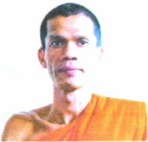
พระราชปรีดีติกวี ศ.ดร.