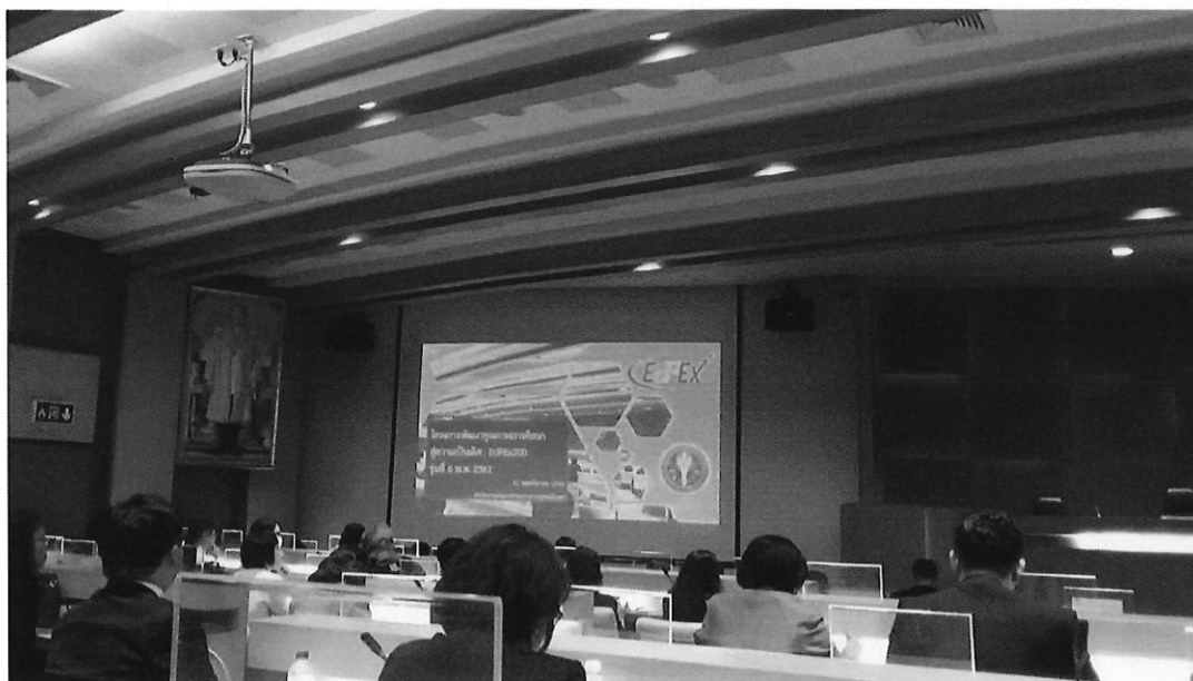
การก้าวสู่โครงการ EdPEX 200 รุ่นที่ 6