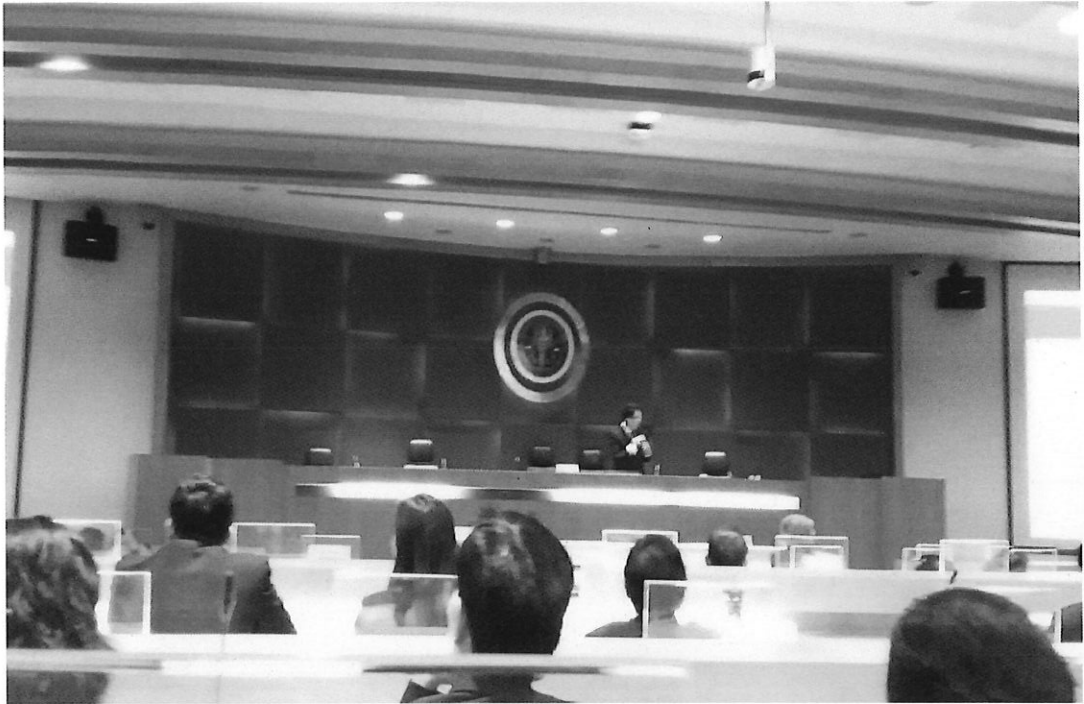
บรรยากาศการณีสึกษามหาวิทยาลัยเชียงใหม่