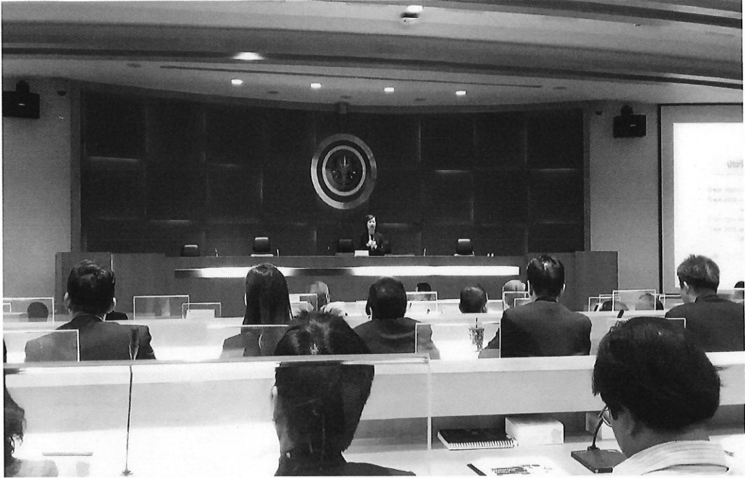
บรรยากาศการประชุมแบบตั้งใจและตั้งใจเพื่อเป้าหมายเดียวกัน