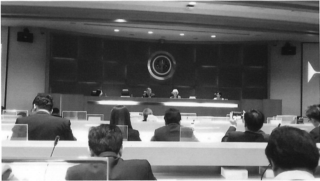
บรรยากาศการประชุมเต็มไปด้วยความเข้มข้น