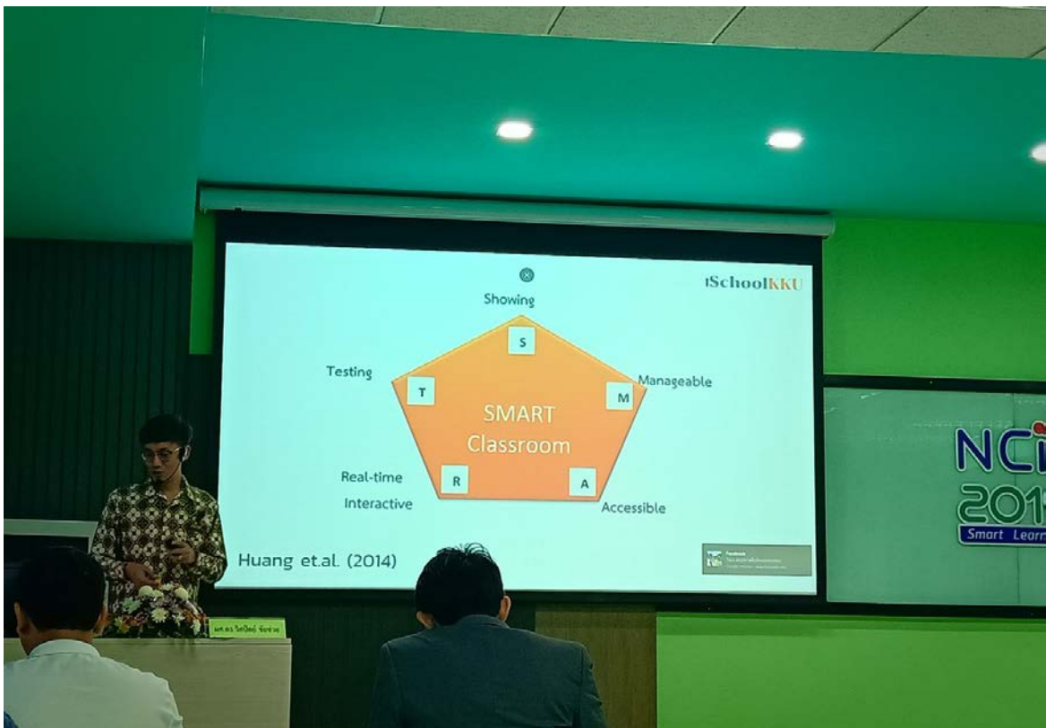
บรรยายกาผลงานประชุมวิชาการระดับชาติ สารสนเทศศาสตร์วิชาการ 2019