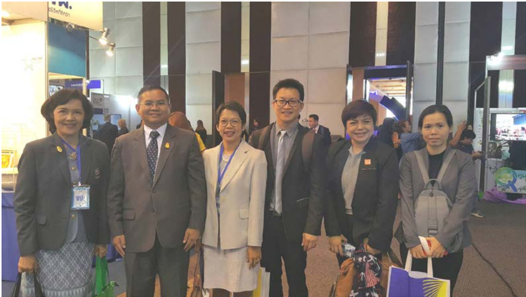
ภาพบรรยากาศภายในงานพบปะแลกเปลี่ยนประสบการณ์กับผู้เชี่ยวชาญในด้านต่างๆ