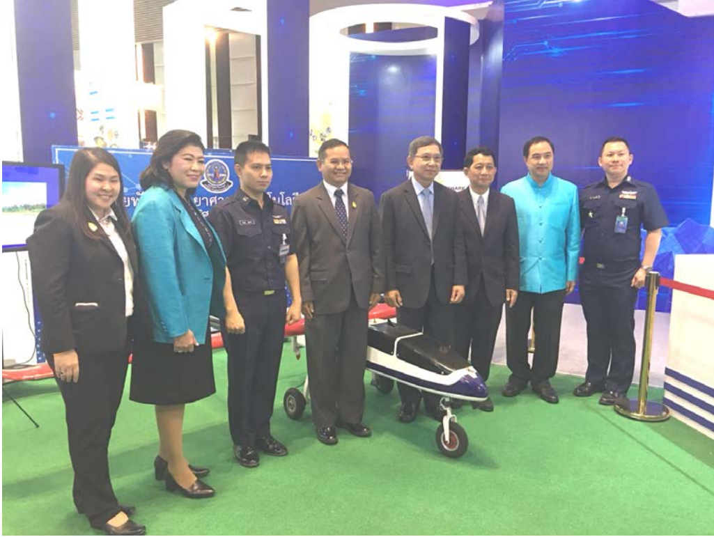
ภาพบรรยากาศการเข้าร่วมกิจกรรม