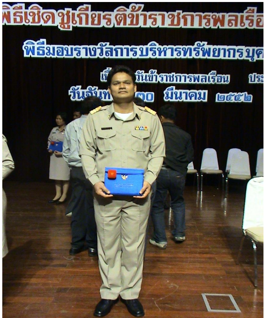
รูปที่ ๒ รับรางวัลข้าราชการพลเรือนดีเด่น (ครูทองคำ) ประจำปีพุทธศักราช ๒๕๕๑ ณ หอประชุมกรมประชาสัมพันธ์ วันจันทร์ที่ ๓๐ มีนาคม ๒๕๕๒