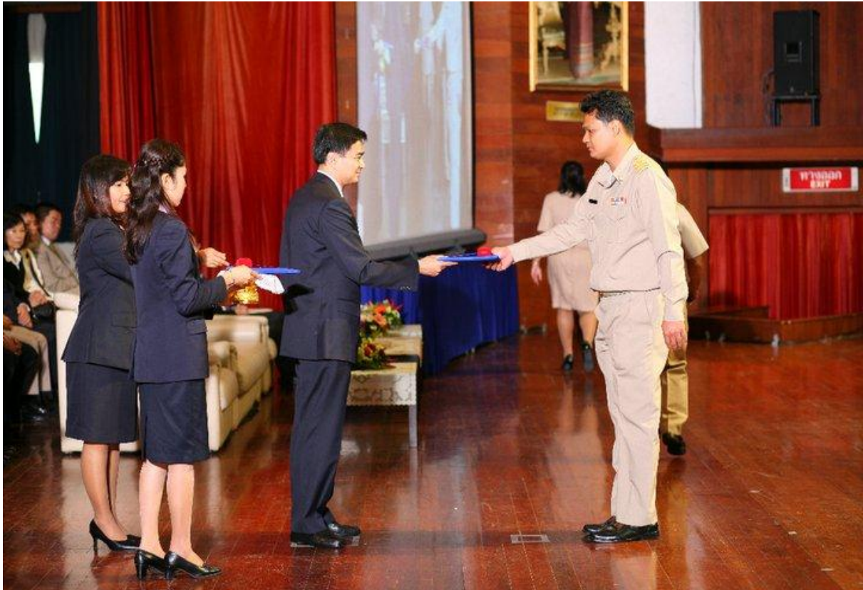
รูปที่ ๑ พิธีรับรางวัลข้าราชการพลเรือนดีเด่น (ครูทองคำ) ประจำปีพุทธศักราช ๒๕๕๑ รับมอบรางวัลจาก ฯพณฯ นายกรัฐมนตรี นายอภิสิทธิ์ เวชชาชีวะ ส่วนราชการที่ ๑๓๘ มหาวิทยาลัยเทคโนโลยีพระจอมเกล้าธนบุรี ลำดับที่ ๒๘๒ กลุ่มที่ ๒ ตามหนังสือที่ ศธ ๐๒๐๑.๔/๘๔๗ ลว.๙ มีนาคม ๒๕๕๒ เนื่องในงานวันข้าราชการพลเรือนประจำปี ๒๕๕๒