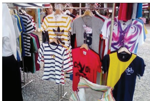
ภาพที่ 4 แสดงศูนย์จำหน่ายอาหารและ สินค้าสำเร็จรูป

การจัดการตลาดในชุมชนบ้านหน้าเขามหาชัยฯ พบว่า การจัดการตลาดเป็นการดูแล รักษาความสะอาดในตลาด และมีจัดระเบียบเรียบร้อยให้แก่บุคคลที่จะมาค้าขายในตลาดบ้าน