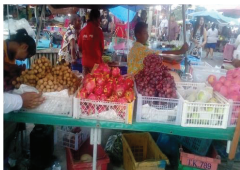
ภาพที่ 2 การวางจำหน่ายผลไม้