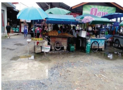
ภาพที่ 1 ตลาดบ้านหน้าเขามหาชัย

ประกอบการค้าขาย และยังเป็นพาหนะแพร่เชื้อโรคต่าง ๆ อีกมากมาย 2) พัฒนาการในยุค การจัดการระเบียบการคมนาคมบนท้องถนน ในยุคสมัยก่อนจะไม่มีระบบจราจร หรือคนมา ช่วยดูแลความปลอดภัยบนท้องถนนหน้าตลาดบ้านหน้าเขามหาชัยมาร่วมการพัฒนา และหา แนวทางแก้ไขปัญหาดังกล่าว และในยุคการจัดการระเบียบการคมนาคมบนท้องถนนจะพัฒนา โครงข่ายระบบคมนาคม เพื่อแก้ปัญหาการจราจร พร้อมทั้งเพิ่มความสะอาดกสบายของคนในยุค การจัดระเบียบการคมนาคม และสร้างความปลอดภัยในการเดินทางให้มีประสิทธิภาพมากขึ้น และ 3) พัฒนาการในยุคศูนย์จำหน่ายอาหาร และสินค้าสำเร็จรูป พบว่า ในยุคศูนย์ จำหน่ายอาหาร และสินค้าสำเร็จรูปในตลาดบ้านหน้าเขามหาชัย เนื่องจากเป็นตลาด ธรรมดาทั่วไปในการจำหน่ายสินค้า ทั้งอาหารแห้ง และอาหารที่ปรุงแต่งในชีวิตประจำวัน