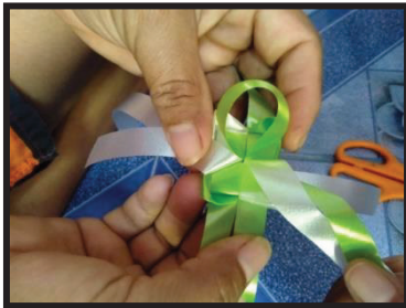
ภาพที่ 3 การทำกลีบดอกบัวชั้นใน