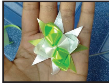
ภาพที่ 4 การทำแบบสำเร็จ

สภาพปัญหาอาชีพการทำเหรียญโปรยทานแบบสวยงามๆ พบว่า ชุมชนบ้านห้วยดินดานพบเจอสภาพปัญหา มี 2 ด้าน ได้แก่ 1) ด้านความชำนาญในการพับเหรียญโปรยทาน ปัญหาความไม่ชำนาญในการพับเหรียญโปรยทาน ทำให้ส่งผลต่อลูกค้าได้รับของล่าช้า และเหรียญโปรยทานอาจออกมาไม่สวยงามตามที่ลูกค้าต้องการเพราะขาดความชำนาญในการทำ จึงต้องฝึกทำบ่อย ๆ และ 2) ) ด้านการส่งเสริมด้านการตลาดและการประชาสัมพันธ์ เกิดจากการไม่มีการประชาสัมพันธ์ที่ชัดเจนในเรื่องของสถานที่ทำเหรียญโปรยทาน และการราคาที่สูงแพงเกินไปเมื่อลูกค้าไปซื้อผ่านแม่ค้าคนกลางและการบรรจุผลิตภัณฑ์ยังไม่เป็นที่ดึงดูดคนซื้อ