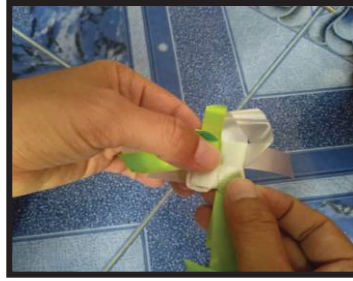
ภาพที่ 2 การทำกลีบดอกบัวชั้นนอก