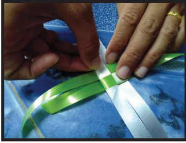
ภาพที่ 1 การพับและการวางเหรียญ