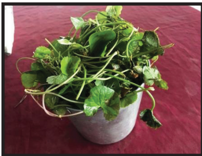
ภาพที่ 1 ไบบวบกที่ใช้ในการผลิตน้ำมันบวบก

พัฒนาการการเกิดกลุ่มอาชีพเพื่อธุรกิจชุมชน พบว่า มี 4 ขั้นตอน ได้แก่ 1) ขั้นตอนตัวของกลุ่ม การจัดตั้งกลุ่มสตรีเกิดขึ้นในปี พ.ศ. 2558 เกิดจากการพูดคุยแลกเปลี่ยนความคิดเห็นเกี่ยวกับปัญหาที่กำลังเผชิญอยู่จากปัญหาการค้าขายพาราที่ตกต่ำ ทำให้รายได้ไม่เพียงพอในการดำรงชีวิตอยากมีอาชีพเสริมมาช่วยเพิ่มรายได้ให้กับครอบครัว จึงคิดทำน้ำมันไบบวบกขึ้นมาเนื่องจากมีความรู้และมีวัตถุดิบพร้อม 2) ขั้นตอนดำเนินการปฏิบัติ ซึ่งหลังจากที่พูดคุยร่วมกันได้เกิดรวมตัวกันจัดตั้งกลุ่ม มีการพูดคุยตกลงกัน และมีการวางแผน วางกฎระเบียบและวางแนวทางในการทำงานของกลุ่มรวมตัวกันตั้งกลุ่มสตรีบ้านไทรเพาหาญ วางแนวทางการทำงานแยกตามที่หน้าการปฏิบัติงาน แบ่งปันหน้าที่ความรับผิดชอบความถนัดของแต่ละคน แล้วจึงลงมือทำน้ำมันไบบวบก 3) ขั้นตอนการขยายตัวของกลุ่ม เมื่อรวมกลุ่มแล้วเริ่มทำน้ำมันไบบวบกขายได้รับการตอบรับจากลูกค้า จึงได้มีการขยายตัวโดยเพิ่มมีการผลิตเพิ่มขึ้น เมื่อกลุ่มมีการเจริญเติบโตมีการขยายการผลิตของกลุ่มมีการระดมทรัพยากรการผลิตจากภายในและภายนอกชุมชน ผลที่ได้รับ คือ มีการตอบรับจากลูกค้า เมื่อซื้อไปใช้แล้วกลับมาซื้อใหม่ และมีการซื้อไปฝากญาติ ๆ ด้วย และ 4) ด้านขั้นตอนสามัคคี กลุ่มสตรีบ้านไทรเพาหาญมีความสามัคคี และเข้มแข็งเนื่องจากสมาชิกส่วนใหญ่เป็นคนในครอบครัวทุกคนในกลุ่มมีความรักใคร่กลมเกลียวกัน คือ ช่วยกันคิด ช่วยกันทำ จนทำให้งานกลุ่มสำเร็จตามวัตถุประสงค์ที่ต้องการ โดยหลังจากกลุ่มมีความเข้มแข็งแล้ว จึงมีความคิดที่จะทำเป็นสินค้า OTOP ของชุมชน โดยการรับสมาชิกเพิ่มขึ้นมีการติดต่อประสานงานกับกลุ่มจากภายนอก เพื่อนำสินค้าไปขายหรือเพื่อหาวัตถุดิบในการผลิตต่อไป