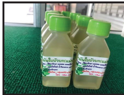
ภาพที่ 2 น้ำมันบวบก