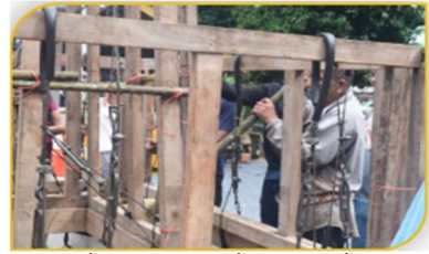
ภาพที่ 25 ขั้นตอนที่ 10 การร้อยลวดสลิงด้านนอกและ การร้อยลวดสลิงด้านใน Figure 25. Step: Stringing the sling inside and outside the boat structure