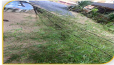
ภาพที่ 13 อุปกรณ์ที่ 12 คือ ไม้ไผ่ตกแต่งเรือพระ