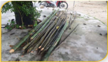
ภาพที่ 6 อุปกรณ์ที่ 5 คือ ไม้ข้างแบบเนื้ออ่อน Figure 6. Tool: Soft Wood for Placing on Each Side of the Religious Boat