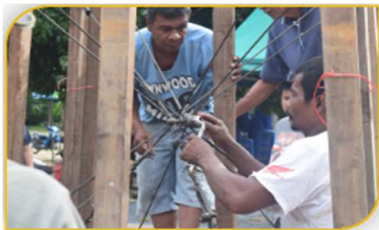
ภาพที่ 22 ขั้นตอนที่ 7 การร้อยหัวใจเรือพระ Figure 22. Step: Stringing the heart of the religious boat