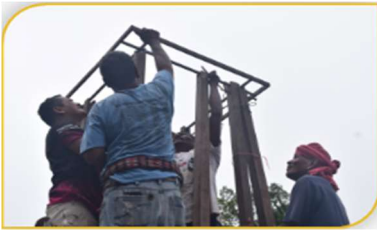
ภาพที่ 26 ขั้นตอนที่ 11 การยกเสาหมเรือ Figure 26. Step: Lifting Sao Nom Ruer