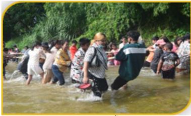
ภาพที่ 45 การร่วมใจพร้อมดึงเรือพระ