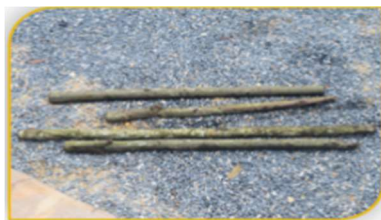
ภาพที่ 9 อุปกรณ์ที่ 8 คือ ไม้ขัดข้างใน Figure 9. Tool: Woods Used for Crossing Inside the Religious Boat