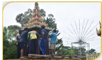
ภาพที่ 31 ขั้นตอนที่ 16 การยกหมเรือ Figure 31. Step: Lifting Nom Ruer