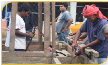
ภาพที่ 20 ขั้นตอนที่ 5 การขึ้นลวดสลิง Figure 20. Step: Slings