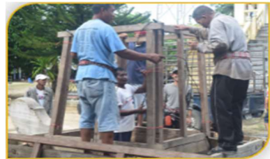
ภาพที่ 21 ขั้นตอนที่ 6 การยึดลวดสลิง Figure 21. Step: Sling holding