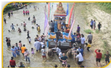
ภาพที่ 47 จุดสิ้นสุดการลากเรือพระ