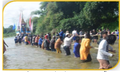
ภาพที่ 44 การมีส่วนร่วมลากพระทางน้ำ