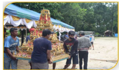
ภาพที่ 29 ขั้นตอนที่ 14 การเคลื่อนย้ายฐานหมเรือ Figure 29. Step: Moving Nom Ruer base