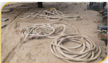
ภาพที่ 8 อุปกรณ์ที่ 7 คือ เชือกลากเรือพระ Figure 8. Tool: Ropes for Pulling the Religious Boat