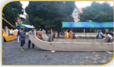
ภาพที่ 2 อุปกรณ์ที่ 1 คือ ฐานลากเรือพระลาก Figure 2. Tool: Base of Religious Boat