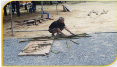
ภาพที่ 12 อุปกรณ์ที่ 11 คือ ไม้ขัดข้างระดับยาว