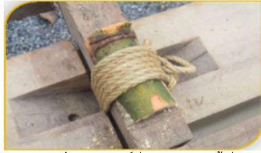
ภาพที่ 11 อุปกรณ์ที่ 10 คือ สลักไม้ไผ่