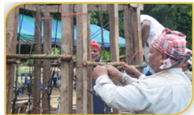
ภาพที่ 23 ขั้นตอนที่ 8 การขัดไม้ Figure 23. Step: Wood crossing