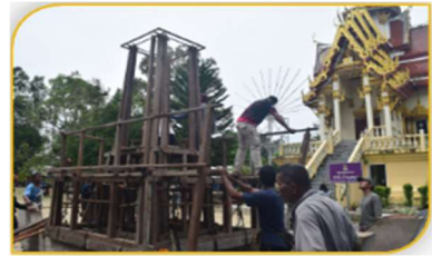
ภาพที่ 27 ขั้นตอนที่ 12 การตกแต่งข้างลำเรือพระ Figure 27. Step: Decorating two sides of the religious boat