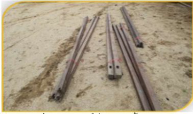
ภาพที่ 10 อุปกรณ์ที่ 9 คือ ไม้เสานมเรือ