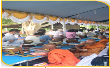
ภาพที่ 35 การทำบุญ