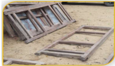
ภาพที่ 5 อุปกรณ์ที่ 4 คือ แผงไม้นาบข้างเรือพระ Figure 5. Tool: Wood Panels Used for Pressing on Two Sides of the Religious Boat