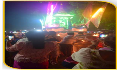
ภาพที่ 40 การเฉลิมฉลองพระลาก