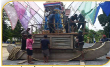
ภาพที่ 32 ขั้นตอนที่ 17 การตกแต่งเรือพระ