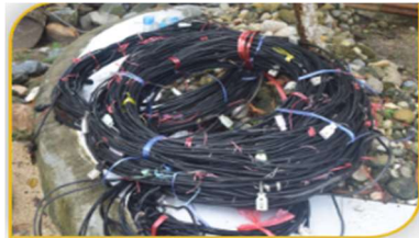
ภาพที่ 7 อุปกรณ์ที่ 6 คือ ลวดสลิง Figure 7. Tool: Sling