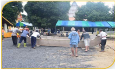
ภาพที่ 16 ขั้นตอนที่ 1 การขึ้นโครงของเรือพระ Figure 16. Step: Building a structure of the religious boat