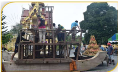
ภาพที่ 30 ขั้นตอนที่ 15 การยกหมเรือ Figure 30. Step: Lifting Nom Ruer