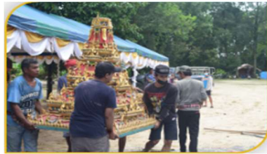
ภาพที่ 15 อุปกรณ์ที่ 14 คือ นมเรือพระ