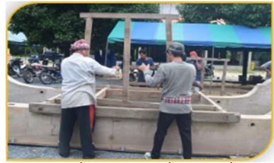
ภาพที่ 19 ขั้นตอนที่ 4 การขึ้นโครงเรือด้านใน Figure 19. Step: Building an inside structure of the religious boat