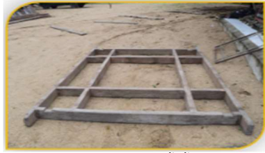
ภาพที่ 3 อุปกรณ์ที่ 2 คือ ฐานชั้นต้นรองเรือพระ Figure 3. Tool: Primary Base to Support the Religious Boat