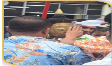
ภาพที่ 38 การสรงน้ำพระลาก