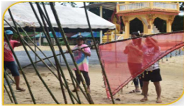
ภาพที่ 14 อุปกรณ์ที่ 13