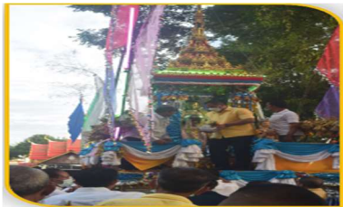
ภาพที่ 41 การตักบาตร