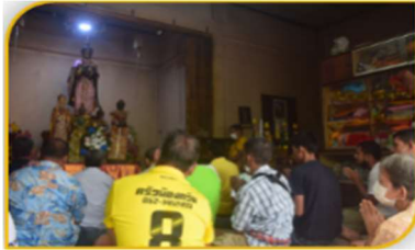
ภาพที่ 37 การทำพิธีอัญเชิญพระลาก