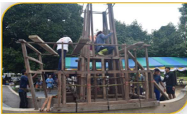
ภาพที่ 28 ขั้นตอนที่ 13 การตกแต่ง Figure 28. Step: Decoration