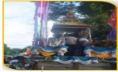
ภาพที่ 36 การฉลองเรือพระ