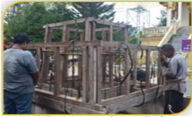
ภาพที่ 24 ขั้นตอนที่ 9 การขึ้นโครงสร้างด้านนอก Figure 24. Step: Building an outside structure of the religious boat