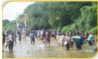
ภาพที่ 46 ความสนุกสนานในการลากพระ