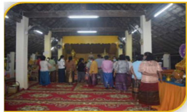
ภาพที่ 34 การอัญเชิญพระลาก