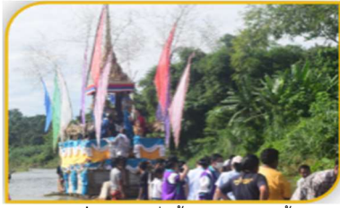
ภาพที่ 43 การเริ่มต้นลากพระทางน้ำ