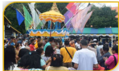
ภาพที่ 42 การลากพระ