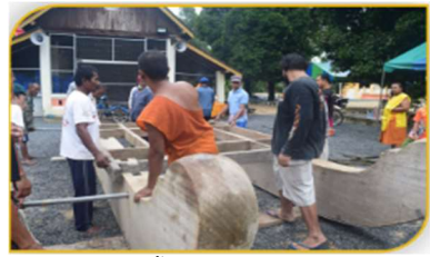
ภาพที่ 17 ขั้นตอนที่ 2 การยกโครงเรือ Figure 17. Step: Lifting a structure of the religious boat