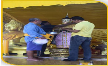
ภาพที่ 39 การแต่งกายพระลาก