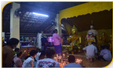
ภาพที่ 33 การตกแต่งเรือพระ

ขั้นตอนที่ 1 การประกอบพิธีการลากเรือพระ ประกอบด้วยวันที่ 1 เริ่มตั้งแต่ขึ้น 13 ค่ำ คณะกรรมการวัดเริ่มทำการหันหัวเรือพระออกจากโรงจอดเรือพระ วันที่ 2 เริ่มตั้งแต่ขึ้น 14 ค่ำ ประชาชนชาวบ้านผู้เป็นประธานพิธีได้อัญเชิญพระลากและร่วมเฉลิมฉลองด้วยการจุดประทัดและแห่ขบวนพระลาก หลังจากนั้นให้ชาวบ้านสงฆ์และรับน้ำพระพุทธรูปเพื่อความศิริมงคล และอัญเชิญพระลากไปยังอาคารประดิษฐานเพื่อให้พุทธศาสนิกชนได้สักการะ และทำบุญตักบาตรด้วยปัจจัย (ด้วยเงินหรือทอง) ภาคกลางคืนของวันที่ 2 มีกิจกรรมเฉลิมฉลองพระลากและเรือพระ โดยการจัดแสดงมโหรีสพ (หนังตะลุงและวงดนตรีสากล) จนถึงเช้ามืด ส่วนวันที่ 3 ซึ่งตรงกับขึ้น 15 ค่ำ มีการเริ่มพิธีกรรมตั้งแต่เช้ามืด โดยการอัญเชิญพระลากออกจากศาลาโรงธรรมไปประดิษฐานยังบุษบกของเรือพระ หลังจากนั้นชาวบ้านร่วมกันลากพระลากเป็นปฐมฤกษ์ ระยะทางประมาณ 100 เมตร และชาวบ้านร่วมกันนำดอกไม้ เทียน ธูป มาปักสองข้างทางที่พระลากลากผ่าน หลังจากนั้นชาวบ้านได้ร่วมกันตักบาตรหน้าล้อ (การตักบาตรในขณะที่มีการแห่เรือพระ) เช่น ของสด กับข้าว ข้าวต้ม ลูกโยน ข้าวต้มมัดสามเหลี่ยม และประชาชนทยอยมานั่งบริเวณรอบ ๆ พระลาก เพื่อเตรียมประกอบพิธีกรรมทางศาสนา มีพระสงฆ์รับข้าวสารอาหารแห้ง จากนั้นพระสงฆ์ให้พรและจบพิธีการทางศาสนา (ดังภาพที่ 33-42)