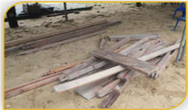
ภาพที่ 4 อุปกรณ์ที่ 3 คือ ไม้ข้างแบบเนื้อแข็ง Figure 4. Tool: Hardwood for Placing on Each Side of the Religious Boat