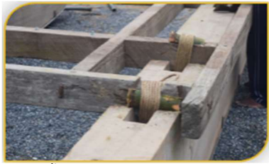
ภาพที่ 18 ขั้นตอนที่ 3 หลังจากที้นำโครงเรือลงยังคานเรือ Figure 18. Step: Taking a boat structure to the boat beam