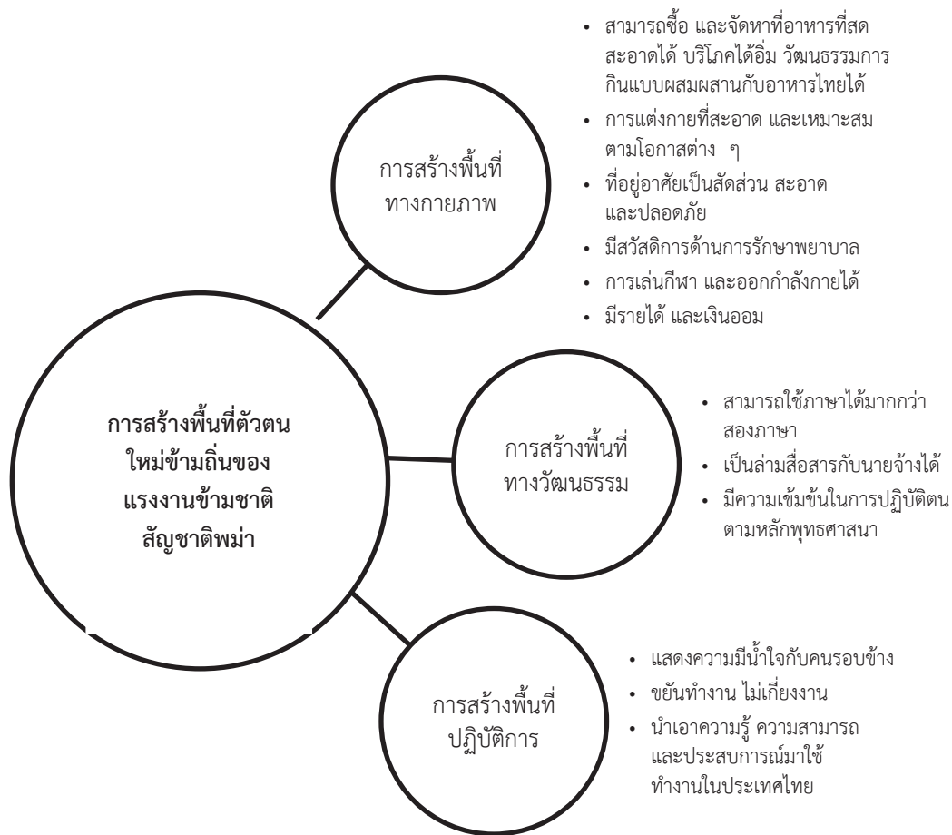
ภาพที่ 1 สรุปลองค์ความรู้การสร้างพื้นที่ตัวตนใหม่ข้ามถิ่นของแรงงานข้ามชาติสัญชาติพม่า