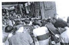
ภาพ 38 แลกเปลี่ยน ความรู้การสักยันต์