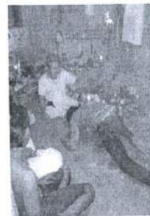
ภาพ 15 การปลุกเสก ของที่สักไปหลังสักยันต์ เสร็จ