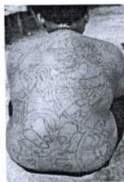
ภาพ 16 หัวหนุมาน