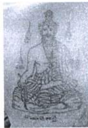
ภาพ 21 ยันต์ฤาษี