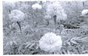
ภาพ 3 ดอกดาวเรือง