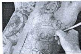
ภาพ 11 การวาดลวดลาย บนผิวหนัง