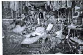
ภาพ 8 การฉายภาพ ให้ครูบาอาจารย์