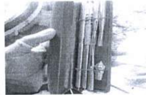
ภาพ 9 เข็มในการสักยันต์