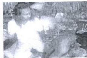
ภาพ 12 การลงเข็มสัก (ด้านหลัง)