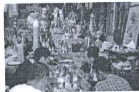
ภาพ 41 การเผยแพร่ และแลกเปลี่ยนความรู้ จากอาจารย์สู่ลูกศิษย์