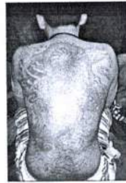
ภาพ 18 มังกรแดง