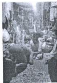
ภาพ 27 ถ่ายทอดวิชาให้ลูกศิษย์