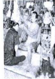
ภาพ 33 การครอบเศียรพ้อแก่