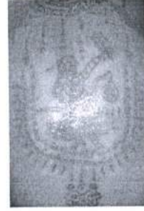
ภาพ 26 ยันต์หนุมาณทรงฤทธิ์

3. แนวทางการอนุรักษ์การสักยันต์ กรณีศึกษา เครือข่ายสำนักสักยันต์อาจารย์วัตร หมู่ที่ 12 ตำบลนาแวง อำเภอฉวาง จังหวัดนครศรีธรรมราช ผลการศึกษาพบว่า