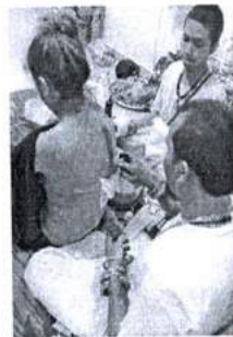
ภาพ 14 การดำเนินการ หลังสักยันต์เสร็จ