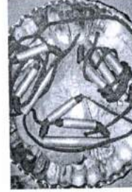
ภาพ 34 ทิศหมอน (ตะกรุด)