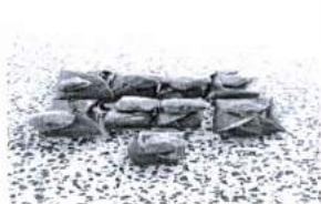
ภาพ 1 หมาก

อีกขั้นตอนหนึ่งในการสักยันต์ เพราะการลงเข็มสักจะเกิดความเจ็บปวดมาก ผู้รับการสัก จึงต้องมี “ความอดทน” มากในการสักยันต์ และอาจารย์สักยันต์ก็ต้องต้องใช้ “สมาธิมาก” เช่นกัน เมื่ออาจารย์สักยันต์เสร็จแล้ว จากนั้นนำน้ำมัน หรือ “ว่าน” ที่ทาก่อนการสัก มาทาอีกครั้งหนึ่ง เพื่อดูว่าการสักนั้น “เด่นชัด” หรือไม่ และบางสำนักหลังจากการสักเสร็จแล้ว จะมีการ “ปลุกของ” หรือเลขยันต์ที่ตนเองสักลงไปตามความชอบส่วนบุคคล ซึ่งสอดคล้อง กับการศึกษาของพระพิฆณพหล สุวณฺณรุโป (พระพิฆณพหล สุวณฺณรุโป, 2554) เรื่อง การศึกษาหลักพุทธธรรม และคุณค่าที่ปรากฏในยันต์เทียนล้านนา : กรณีศึกษาเฉพาะ ในเขตอำเภอเมือง จังหวัดลำปาง ได้สรุปว่า “การบูชาครู” ถือเป็นสิ่งสำคัญในการ จะประกอบพิธีลงยันต์ยันต์ มักจะมีการขึ้นครู หรือบูชาครู เพื่อเป็นการสักการบูชาคารวะ น้อมระลึกถึงครูบาอาจารย์ที่ได้ถ่ายทอดวิชาความรู้ให้ และเพื่อเกิด “ความขลัง” ศักดิ์สิทธิ์ ต้องทำใจให้เอิบอิม แ่มขื่น เบิกบานประกอบไปด้วยเมตตา ในขณะที่ลงยันต์เกี่ยวกับ เรื่องเมตตามหานิยม โชคลาก หัวใจสำคัญของการทำยันต์ ก่อนจะเริ่มเขียนยันต์จะต้อง “เตรียมอุปกรณ์” สำหรับลงยันต์ เวลาทำจะต้องตั้งใจให้บริสุทธิ์เป็น “สมาธิ” ระลึกถึง คุณครูบาอาจารย์ จากนั้นจึงค่อยๆ สักยันต์เป็น “ตัวอักษร” หรือเป็นตัวเลข นับตั้งแต่ผู้สัก ยันต์ วิสตุ ถูกขัยาม การบูชาครู คาถาที่ใช้ ขั้นตอนการทำ ข้อปฏิบัติ การใช้สถานที่ และมีหัวข้อหลักพุทธธรรมที่แทรกไว้ในยันต์ตามความเชื่อนั้นๆ (ดังภาพ 1 - 15)