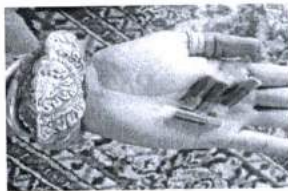
ภาพ 10 น้ำหมึก