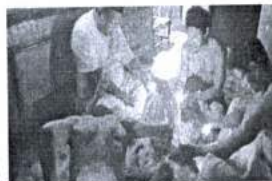
ภาพ 39 แลกเปลี่ยนความรู้ เรื่องปลุกของ