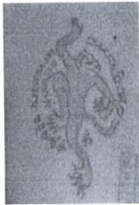
ภาพ 24 ยันต์ลึงลม