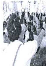
ภาพ 32 การไหว้ครูผู้สักยันต์