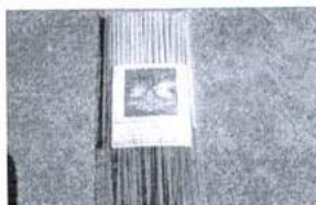
ภาพ 4 รูป