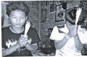
ภาพ 7 พิธีไหว้บูชาครู