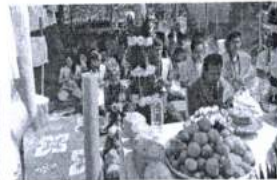
ภาพ 37 การรวมไหว้ครู ของทุกปี