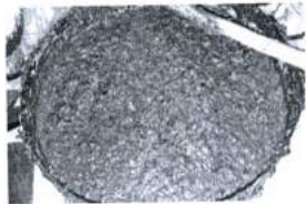
ภาพ 35 ว่างสำหรับไหว้ครู