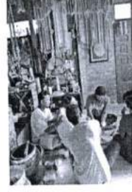
ภาพ 30 รักษาทางไสยศาสตร์