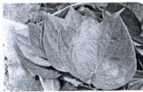
ภาพ 2 ใบพลู