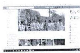
ภาพ 42 การเผยแพร่ภาพการสักยันต์ ของสำนักสักยันต์ทางสื่อออนไลน์