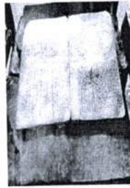
ภาพ 28 ตำราในการสักยันต์