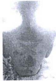
ภาพ 22 ยันต์เก้ายอด