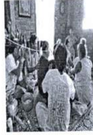
ภาพที่ 29 รักษาคนป่วย