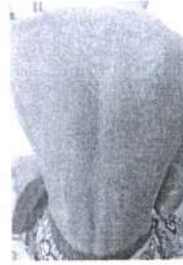
ภาพ 19 นักร่ำขามูไร