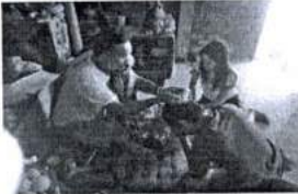
ภาพ 36 รดน้ำดำหัว ครูบาอาจารย์