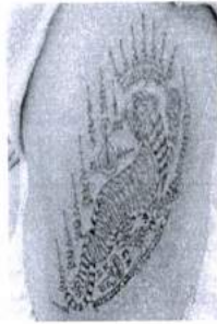
ภาพ 25 ยันต์เสื่อเหลียวหลัง