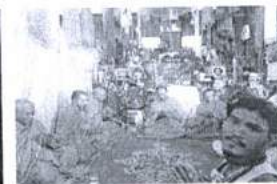
ภาพ 40 ทำบุญ ที่สำนักสักยันต์