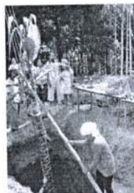
ภาพ 31 ร่วมพิธีขึ้นบ้านใหม่