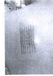
ภาพ 23 ยันต์ห้าแฉก