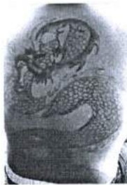
ภาพ 17 มังกรดำ