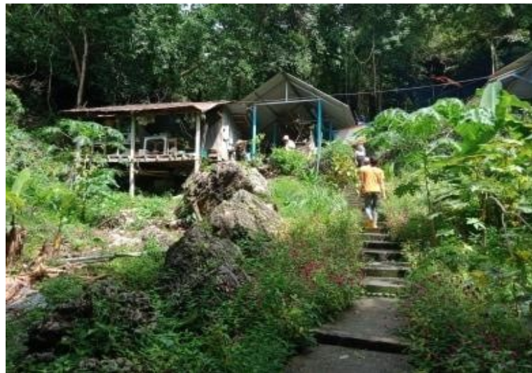
ภาพที่ 1 ทางบันไดเดินขึ้นไป ณ สำนักทวดพราหมณ์เขาอ้อ

2.4 สถานที่ประกอบพิธี ผลการศึกษาพบว่า ในอดีตการประกอบพิธีจะทำกันภายในบริเวณภายในถ้ำถันต์บรรพต วัดเขาอ้อ หมู่ที่ 3 ตำบลมะกอกเหนือ อำเภอกวนขนุน จังหวัดพัทลุง แต่ปัจจุบันจะทำพิธีบริเวณ สำนักทวดพราหมณ์เขาอ้อ (อาจารย์ผล) บนภูเขาที่มีชื่อว่า เขาอ้อ ทางขึ้นจะอยู่บริเวณที่จุดปะทัดของวัดเขาอ้อ (ดังภาพที่ 1)