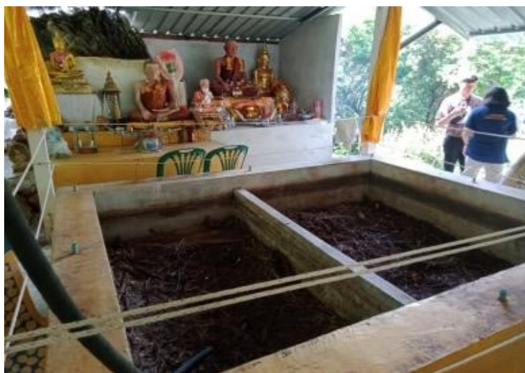
ภาพที่ 2 สถานที่การแช่ว่านยา

2.7.2 ขั้นที่ 2 การเตรียมสถานที่ ในอดีตการประกอบพิธีจะทำกันภายในบริเวณภายในถ้ำถ้ำหินต์บรรพตในปัจจุบันมักจะมีการประกอบพิธีบริเวณ สำนักทวดพรหมณ์เข่าอ้อ (อาจารย์ผล) บนภูเขาที่มีชื่อว่า เข่าอ้อ ทางขึ้นจะอยู่บริเวณที่จุดปะทัดของวัดเข่าอ้อ โดยผู้ประกอบพิธีจะช่วยกันเตรียมสถานที่ ไม่ว่าจะเป็นการทำความสะดวกอย่างพิธี การเตรียมบริเวณโดยรอบ เช่น โต๊ะหมู่บูชา สถานที่ตั้งเครื่องบูชา และที่นั่งสำหรับผู้เข้าร่วมพิธี (ดังภาพที่ 2)