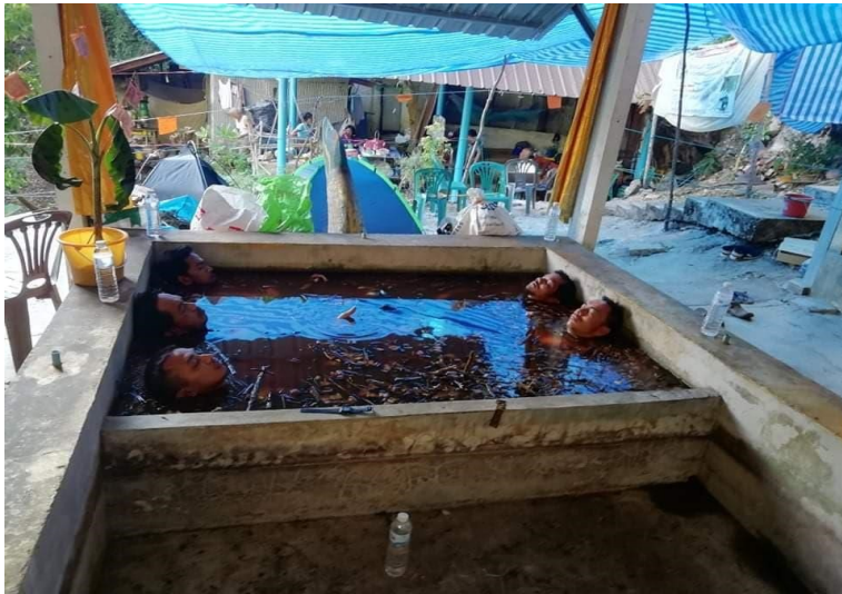
ภาพที่ 4 ลูกศิษย์ลงนอนแช่ว่านยาในราง