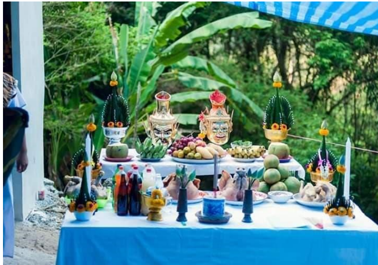
ภาพที่ 3 เครื่องบวงสรวงไหว้ครู

2.7.4 ขั้นที่ 4 การปลุกเสกวานยา พระอาจารย์จะนำวานยาทุกชนิดมาลงอักขระเลขยันต์ และปลุกเสกเพิ่มความขลัง ความศักดิ์สิทธิ์ให้มากยิ่งขึ้น เพราะโดยธรรมชาติเชื่อกันว่า วานยาแต่ละชนิดจะมีความศักดิ์สิทธิ์ และมีสรรพคุณทางยาอยู่ในตัวแล้ว ดังนั้นการปลุกเสกของพระอาจารย์จึงเป็นการเพิ่มพลังความศักดิ์สิทธิ์ให้เกิดมากขึ้น ส่วนเครื่องวานยาสำคัญที่ใช้ในการประกอบพิธีมีมากไม่ต่ำกว่า 108 ชนิด วานยาเหล่านี้บางชนิดหายากบางชนิดหายากต้องใช้เวลาแรมปี บางชนิดใช้ราก บางชนิดใช้ลำต้น หรือบางชนิดใช้ราก ใบ ดอก และผล เรียกว่า “เบญจภาคี” เป็นส่วนผสมในการแช่วานยา