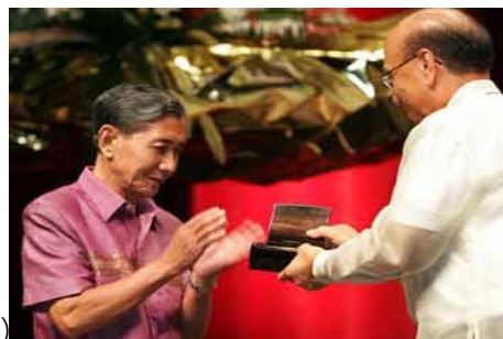
ภาพที่ 4 การเข้ารับรางวัลแมกไซไซ ที่ประเทศฟิลิปปินส์