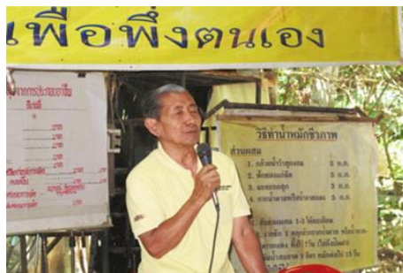
ภาพที่ 2 การบรรยายความรู้ ณ ศูนย์ศึกษาและพัฒนาชุมชนไม้เรียง