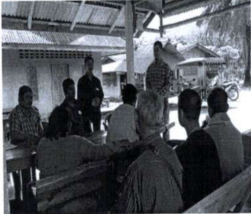
ภาพที่ 1 แสดงการวางแผนการทำงาน

กันให้สำเร็จผล รวมถึงสอดคล้องกับการศึกษาของฐิติพร บุญล้วน (2554) เรื่องความสามัคคี ได้กล่าวว่า ความสามัคคีเป็นสิ่งคุ้มครองป้องกันอันตราย ถ้าชาติใดมีความสามัคคีพร้อมเพียงกัน ชาตินั้นก็มีพลังต่อสู้เข้มแข็ง หากมีชาติอื่นมารุกรานก็สามารถรวมกำลังต่อสู้เพื่อรักษาอิสรภาพไว้ได้