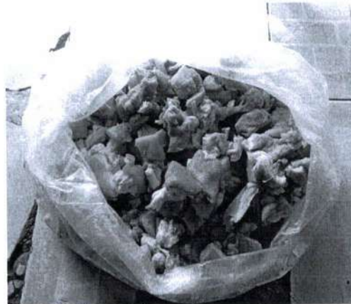
ภาพที่ 4 เนื้อแพะสำเร็จรูป