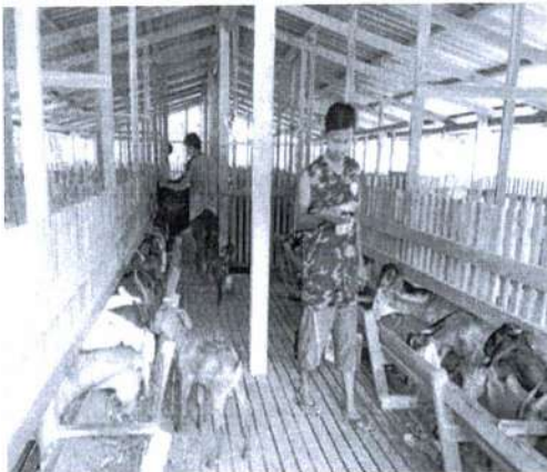
ภาพที่ 3 แสดงการทำงานของสมาชิกในกลุ่ม