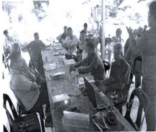
ภาพที่ 2 แสดงนำเทคโนโลยีมาใช้ในการประชุม