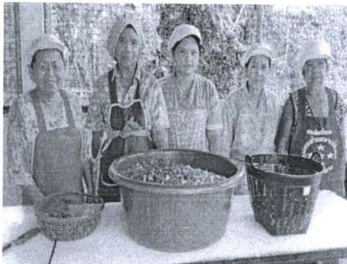
ภาพที่ 1 การรวมกลุ่มของสมาชิก