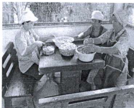
ภาพที่ 2 การแบ่งหน้าที่ทำงานของกลุ่ม