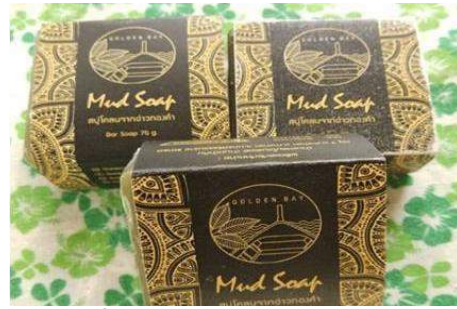
ภาพที่ 4 ผลิตภัณฑ์สำหรับพอกหน้า