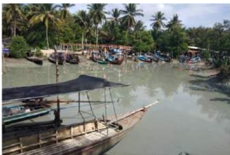
ภาพที่ 1 การออกเรือไปหาโคลน

จากข้อมูลวิธีการผลิตภัณฑ์จากโคลนพอกผิวเพื่อส่งเสริมอาชีพของคนในชุมชน สภาพปัญหาการทำผลิตภัณฑ์จากโคลนพอกผิวเพื่อส่งเสริมอาชีพของคนในชุมชน และการสร้างมูลค่าเพิ่มผลิตภัณฑ์จากโคลนพอกผิวเพื่อส่งเสริมอาชีพของคนในชุมชน กรณีศึกษา บ้านแหลมโฮมสเตย์ หมู่ที่ 7 บ้านหน้าทับ ตำบลท่าศาลา อำเภอท่าศาลา จังหวัดนครศรีธรรมราช ดังภาพที่ 1-6