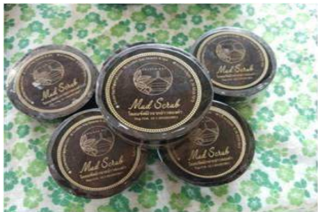
ภาพที่ 5 ผลิตภัณฑ์โคลนแบบกระปุก