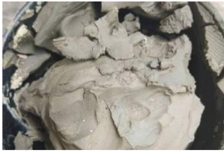
ภาพที่ 3 โคลนดินแสงแดดจนเปลี่ยนรูปร่าง