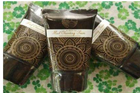
ภาพที่ 6 ผลิตภัณฑ์โคลนแบบหลอด