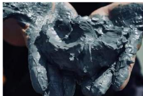
ภาพที่ 2 เนื้อโคลนละเอียด