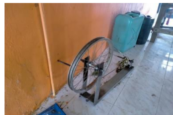
ภาพที่ 3 ไน