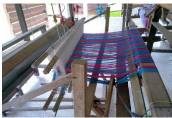
ภาพที่ 13 เส้นไหม ขาดคุณภาพ

2.3 ปัญหาของเรื่องการขาดต้นทุนการผลิตของเงินทุนในการซื้ออุปกรณ์ทอผ้า เพราะในบางครั้งอุปกรณ์ในการทอผ้าทำให้เกิดความเสียหาย และไม่มีต้นทุนที่จะซื้อใหม่ต้องรอต้นทุนที่จะเข้ามาให้กับทางกลุ่มนั้นเพื่อนำไปซื้ออุปกรณ์การทอผ้า ต้นทุนทางกลุ่มต้องใช้อย่างประหยัดทุกครั้งที่เข้ามาเป็นส่วนสำคัญต่อการทอผ้า (ดังภาพที่ 13-14)