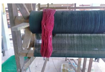
ภาพที่ 7 การลอกกาว