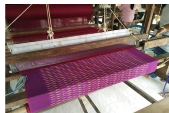
ภาพที่ 18 ลวดลายของบน ผืนผ้าที่จะทอ เช่น ลายลูกแก้ว