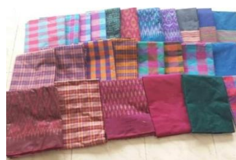
ภาพที่ 12 ผ้าทอสมบูรณ์

2. ปัญหาและอุปสรรคการทอผ้าที่บ้านในชุมชนวังเต่าศุภย์ส่งเสริมอาชีพทอผ้า ตำบลเขา โร อำเภอยางชุมน้อย จังหวัดนครศรีธรรมราชผลการวิจัยดังนี้