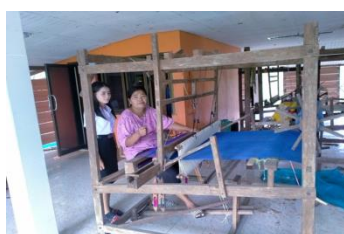
ภาพที่ 11 การการทอผ้า