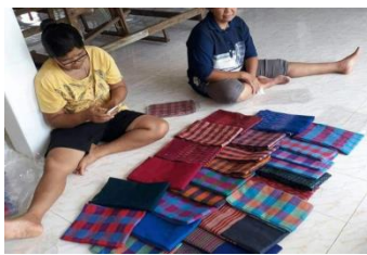
ภาพที่ 14 ปัญหาการจำหน่าย เนื่องจากราคาสูง