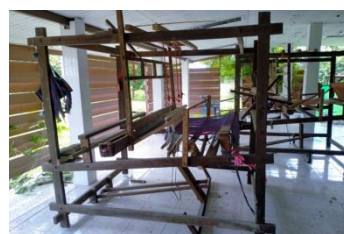
ภาพที่ 6 กี่ทอผ้า