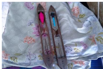
ภาพที่ 2 แกนกระสวย