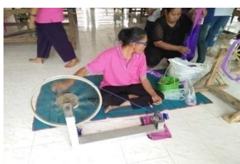
ภาพที่ 10 การกรอเส้นด้าย