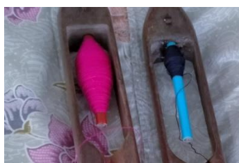
ภาพที่ 5 หลอดด้าย