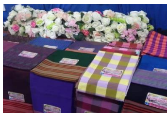
ภาพที่ 17 นำผ้าไปจัดแสดง ในงานของตำบล