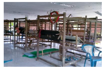
ภาพที่ 15 ปัญหาอุปกรณ์ ชำรุด และไม่มีทุนในการจัดซื้อ

3. แนวทางการส่งเสริมการทอผ้าที่บ้านในชุมชนวังเต่าคุนย์ส่งเสริมอาชีพทอผ้า ตำบลเขาไร่ อำเภอทุ่งสง จังหวัดนครศรีธรรมราชผลการวิจัยดังนี้