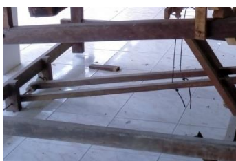
ภาพที่ 4 ไม้เหยียบบहुก