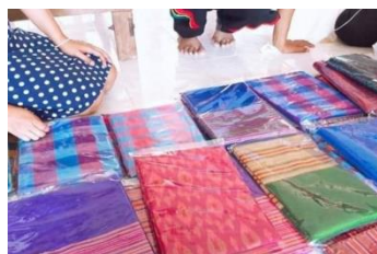
ภาพที่ 16 เตรียมจะนำผ้าทอ ส่งให้กับลูกค้าที่สั่งทาง ออนไลน์