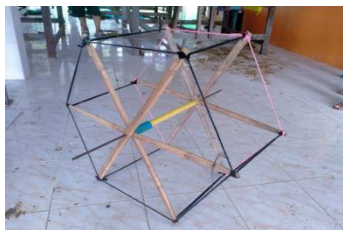
ภาพที่ 1 กง