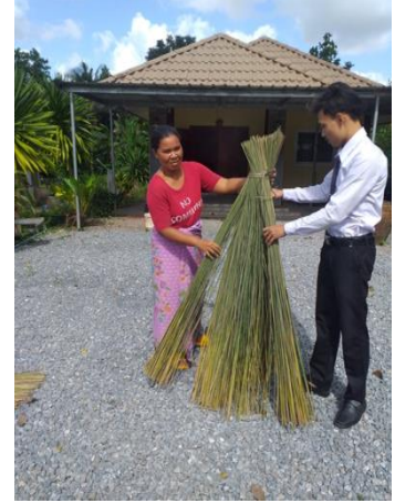
ภาพที่ 3 ตากกระจูด