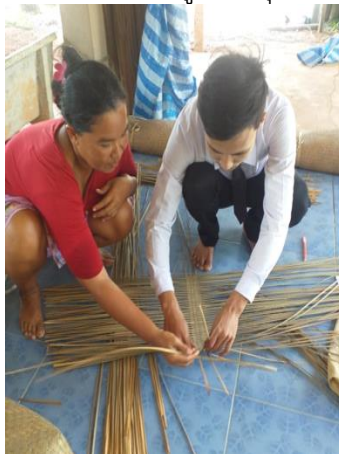
ภาพที่ 5 จักสานเสื่อกระจูด ลายดั้งเดิม (ลายซัด)