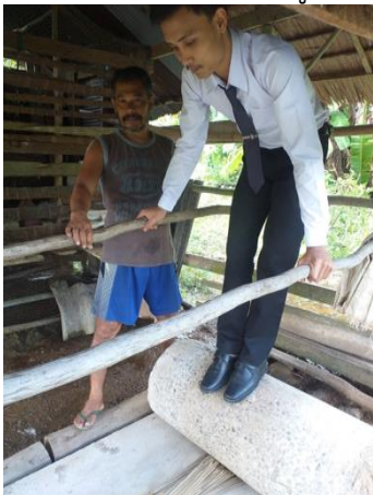
ภาพที่ 4 ริดกระจูด ด้วยลูกกลิ้ง