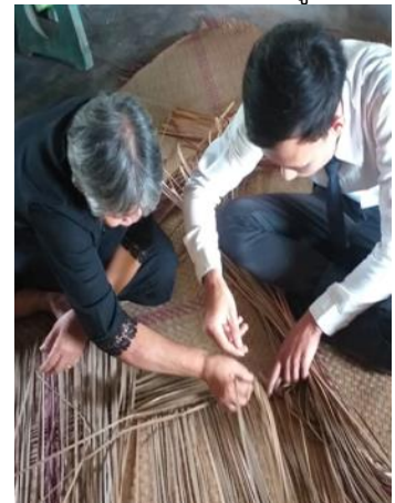
ภาพที่ 6 จักสานเสื่อกระจูด ลายดั้งเดิม (ลายสอง)