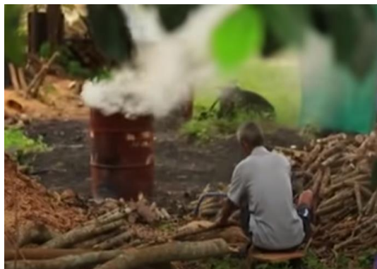
ภาพที่ 4 ความไม่สอดคล้องกับวิธีการผลิต