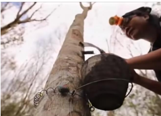
ภาพที่ 3 ถูกสร้างเชื่อมั่นว่าการปลูกยางพารารายได้สูง และรวย