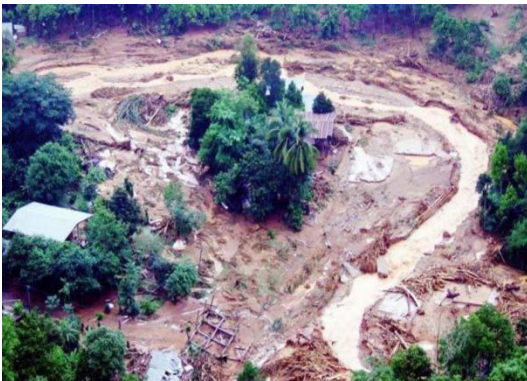
ภาพที่ 1 ความเสียหายจากเหตุการณ์วาตภัยในพื้นที่อำเภอพิปูน จังหวัดนครศรีธรรมราช

ทั้งนี้ต้องพิจารณาถึงทางรอด คือ บริเวณพื้นที่การเกษตรในชุมชนเป็นพื้นที่ป่าทึบ หรือ “สวนสมรม” ซึ่งเป็นพืช และไม้ผลต่าง ๆ ที่ปลูกรวมกันในพื้นที่เดียว ผลนี้สะท้อนถึงทางรอด แม้บางครั้งต้องพึ่งพา “ระบบตลาด” แต่ก็ยังสามารถควบคู่กับ “ระบบวิธีการผลิตในครัวเรือน” ผลนี้สะท้อนถึงทางรอดได้ ดังภาพที่ 1-4