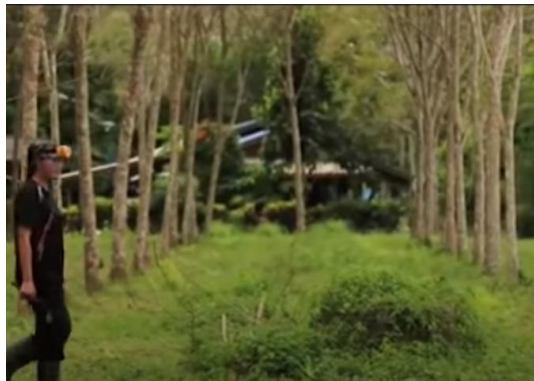
ภาพที่ 2 การฟื้นฟูภาคเกษตร ด้วยการส่งเสริมการปลูกยางพารา