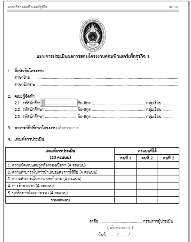
รูปที่ 6 แบบฟอร์ม BC-06