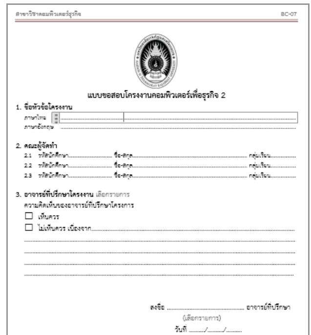
รูปที่ 7 แบบฟอร์ม BC-07