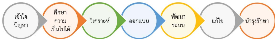
ภาพที่ 1: แสดงขั้นตอนการออกแบบและพัฒนาระบบ

ในการออกแบบและพัฒนาระบบซอฟต์แวร์นั้น ผู้วิจัยได้พัฒนาระบบให้สามารถจัดการข้อมูลรายละเอียดเกี่ยวกับห้องพัก เช่น การจองห้องพัก การตรวจสอบสถานะห้องพัก การตรวจสอบค่าเช่าห้องพักได้ โดยนำวงจรการพัฒนา ระบบ SDLC เข้ามาปรับใช้ร่วมกับระบบ ซึ่ง (อรยา ปรีชาพานิช, 2557) มีขั้นตอนการดำเนินงานดังภาพที่ 1