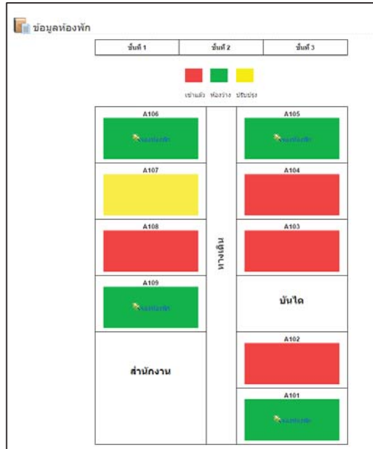
ภาพที่ 5: แสดงสถานะห้องพัก

จากภาพที่ 5 แสดงสถานะห้องพัก โดยแสดงในรูปแบบของผังห้องพักตาม โครงสร้างของอาคารหอพัก ซึ่งผู้เช่าสามารถคลิกเลือกเมนูห้องพักที่มีสถานะห้องว่าง (สีเขียว) เพื่อทำการจองห้องพักได้เท่านั้น