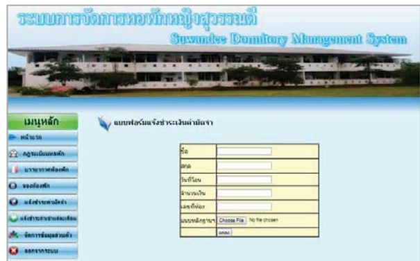
รูปที่ 6 แสดงฟอร์มแจ้งชำระเงินมัดจำ

จากรูปที่ 5 แสดงสถานะห้องพักซึ่งแทนด้วยแถบสี 3 สี ได้แก่ 1) สีเขียว สถานะคือว่า 2) สีส้ม สถานะคือ ว่าง และ 3) สีเหลือง สถานะคือ ปรับปรุง เพื่อป้องกันให้ผู้เช่าทราบและสามารถเลือกจองห้องพักได้สะดวกและรวดเร็วมากยิ่งขึ้น เมื่อผู้ใช้เลือกห้องได้ตามต้องการแล้ว ระบบจะแสดงหน้าการชำระเงินมัดจำ แสดงดังรูปที่ 6