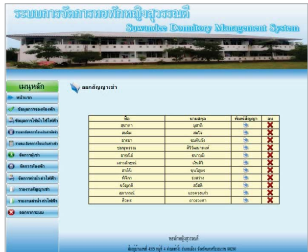
รูปที่ 10 แสดงหน้าเมนูออกสัญญาเช่า

จากรูปที่ 9 แสดงข้อมูลการจองห้องพักในส่วนของผู้ดูแลระบบ เมื่อผู้ดูแลระบบทำการตรวจสอบข้อมูลพื้นฐานของผู้เข้าเรียบร้อยแล้ว ผู้ดูแลระบบสามารถสั่งพิมพ์สัญญาการเช่าห้องพักได้เลย แสดงดังรูปที่ 10