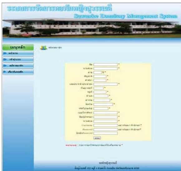
รูปที่ 3 แสดงหน้าสมัครสมาชิก

เมื่อผู้ใช้งานเรียกดูระบบจัดการหอพักผ่านเว็บเบราว์เซอร์แล้ว ระบบจะแสดงผลพีชชีขึ้นมา โดยมีข้อมูลข่าวประชาสัมพันธ์ของหอพัก หากผู้ใช้ประสงค์จองห้องพัก สามารถคลิกเมนูสมัครสมาชิกเพื่อทำการจองห้องพัก ซึ่งจะมีรายละเอียดต่าง ๆ เกี่ยวกับผู้เช่าให้กรอกข้อมูล ดังรูปที่ 3