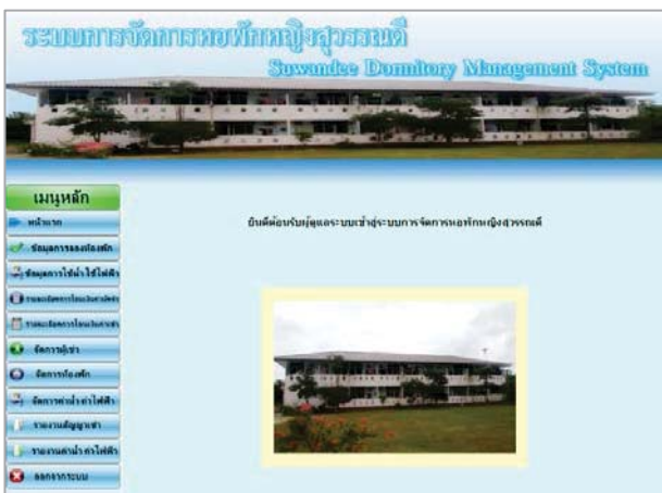
รูปที่ 8 แสดงเมนูจัดการข้อมูลของผู้ดูแลระบบ

สำหรับส่วนของผู้ดูแลระบบนั้น ผู้ดูแลระบบ สามารถจัดการข้อมูลเกี่ยวกับห้องพักได้ เช่น ข้อมูลผู้ใช้ ข้อมูลห้องพัก ข้อมูลค่าน้ำ ค่าไฟ เป็นต้น ซึ่งในส่วนนี้ผู้ดูแลระบบจะต้องลงชื่อเข้าใช้งานก่อนจึงจะสามารถเพิ่ม ลบ แก้ไขข้อมูลได้ แสดงดังรูปที่ 8