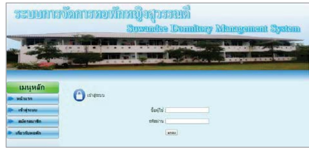
รูปที่ 4 แสดงหน้าเข้าสู่ระบบ

จากรูปที่ 3 แสดงหน้าสมัครสมาชิก เมื่อผู้ใช้คลิกเลือกเมนูสมัครสมาชิกแล้ว ระบบจะแสดงฟอร์มสำหรับข้อมูลส่วนตัวของผู้เช่า ซึ่งผู้เช่าจะต้องกรอกข้อมูลที่เป็นจริงเพื่อยืนยันตัวตนว่ามีอยู่จริง หลังจากนั้นให้กดปุ่มบันทึกเพื่อบันทึกข้อมูลเข้าสู่ระบบ ผู้ใช้จะได้รับรหัสเข้าใช้งานพร้อมกับรหัสผ่าน แสดงดังรูปที่ 4