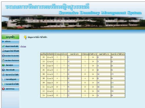
รูปที่ 12 แสดงเมนูจัดการข้อมูลการใช้ น้ำ ใช้ไฟฟ้า

จากรูปที่ 11 ผู้ดูแลระบบสามารถพิมพ์รายงานสัญญาเช่าห้องพักรออาศัยได้ทันที โดยไม่จำเป็นต้องพิมพ์ข้อมูลส่วนตัวของผู้เช่า ซึ่งระบบจะทำการดึงข้อมูลส่วนตัวของผู้เช่าที่ได้ทำการกรอกไว้ตอนสมัครสมาชิกมาแสดงในส่วนของรายงานสัญญาเช่าอัตโนมัติ นอกจากนี้ผู้ดูแลระบบยังสามารถจัดการข้อมูลค่า - ค่าไฟ ได้อีกด้วย แสดงดังรูปที่ 12