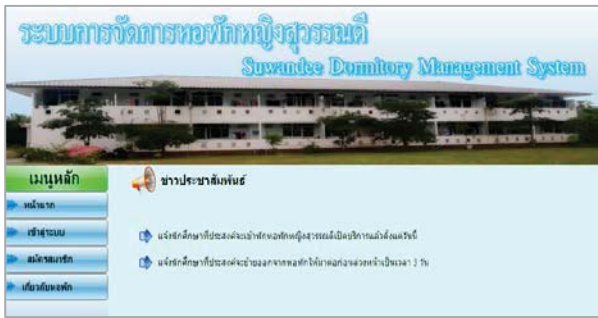
รูปที่ 2 แสดงหน้าหลักของระบบจัดการหอพัก

เมื่อผู้ใช้งานเรียกดูระบบจัดการหอพักผ่านเว็บเบราว์เซอร์แล้ว ระบบจะแสดงผลพีชชีขึ้นมา โดยมีข้อมูลข่าวประชาสัมพันธ์ของหอพัก หากผู้ใช้ประสงค์จองห้องพัก สามารถคลิกเมนูสมัครสมาชิกเพื่อทำการจองห้องพัก ซึ่งจะมีรายละเอียดต่าง ๆ เกี่ยวกับผู้เช่าให้กรอกข้อมูล ดังรูปที่ 3