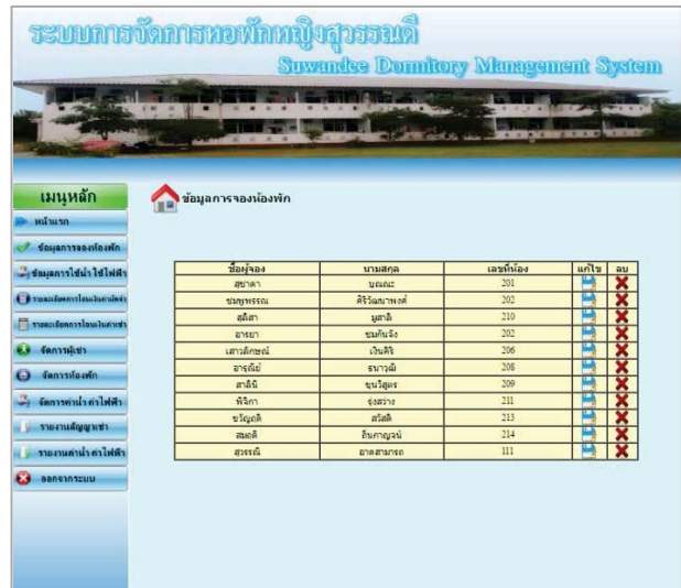
รูปที่ 9 แสดงข้อมูลการจองห้องพักในส่วนของผู้ดูแลระบบ

จากรูปที่ 8 ผู้ดูแลระบบสามารถจัดการข้อมูลต่าง ๆ ได้ ตัวอย่างเช่น การจัดการข้อมูลการจองห้องพัก เมื่อผู้ใช้ทำการจองห้องพักเรียบร้อยแล้ว ข้อมูลจะถูกบันทึกเข้าระบบ ผู้ดูแลระบบจะต้องทำการตรวจสอบข้อมูล เพื่อตรวจสอบข้อมูลพื้นฐานของผู้เข้า แสดงดังรูปที่ 9