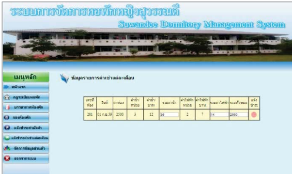
รูปที่ 7 แสดงรายการค่าเช่า, ค่าน้ำ-ค่าไฟ

จากรูปที่ 6 เมื่อผู้เข้าได้ทำการจองห้องพักเรียบร้อยแล้ว ผู้เข้าจะต้องโอนเงินค้ำมัดจำ เพื่อยืนยันการจอง โดยผู้เข้าสามารถแจ้งยอดการโอนเงินมัดจำผ่านระบบพร้อมแนบหลักฐานการโอนได้เลย ในแต่ละเดือนนั้น ผู้เข้าสามารถเข้าสู่ระบบเพื่อตรวจสอบค่าเช่า รวมถึงค่าน้ำ ค่าไฟ ผ่านระบบจัดการห้องพักได้ทันที แสดงดังรูปที่ 7