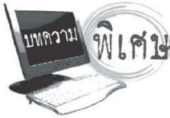
ผู้เชี่ยวชาญการประยุกต์ใช้ ประยุกต์ใช้เทคโนโลยีและการศึกษา กับระบบสารสนเทศและสังคมศาสตร์ มหาวิทยาลัยราชภัฏนครราชสีมา

ซึ่งมีคำย่อของ VUCA แต่ละตัวอักษรแทนคุณสมบัติของโลกได้แก่ โลกที่ผันแปร (Volatility) ไม่แน่นอน (Uncertainty) ซับซ้อน (Complexity) และคลุมเครือ (Ambiguity) ซึ่งเป็นแนวคิดในการอธิบายโลกในมิติต่างๆ ที่ต่างจากเศรษฐกิจ สังคม วัฒนธรรม หรือแม้แต่ การศึกษา มาเป็นระยะเวลาหนึ่งแล้วกว่า 40 ปีแล้ว แต่ใน