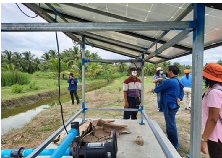
ภาพที่ 2 การใช้โซล่าเซลล์แทนการใช้ไฟฟ้าจากภาครัฐฯ เพื่อการพึ่งพาตนเอง

3. คำนึงถึงส่วนรวมร่วมกัน หรือผลประโยชน์สาธารณะ ตลอดจนการมีจิตอาสากระบวนการพัฒนาที่สามารถทบทวนผลกระทบที่เกิดขึ้นต่อชุมชน และวิถีชีวิตของคนในชุมชนเพื่อความร่วมมือและเครือข่ายการเรียนรู้ในชุมชนสังคมท้องถิ่น เช่น เกษตรกรมีความเห็นว่าระบบสูบน้ำบาดาลด้วยระบบโซล่าเซลล์ไม่ก่อให้เกิดมลพิษต่อสิ่งแวดล้อมและสุขภาพอนามัย เป็นการใช้ทรัพยากรธรรมชาติที่คุ้มค่า (ชัชฉันทน์ วัฒนวรสิน, 2562 : 1677-1687) ประกอบกับในพื้นที่เทศบาลเมืองปากพูนจังหวัดนครศรีธรรมราช เช่น สวนมะพร้าวในชุมชนที่นำโซล่าเซลล์มาใช้แทนการใช้ไฟฟ้าจากภาครัฐฯ เพื่อการพึ่งพาตนเอง ประหยัดพลังงานและการใช้พลังงานจากแสงอาทิตย์ไม่ก่อให้เกิดมลพิษในชุมชน ดังภาพที่ 2