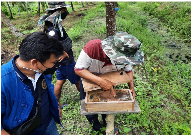
ภาพที่ 3 การเรียนรู้และนำไปปฏิบัติจริง เช่น การเลี้ยงผึ้งและชันโรง

4. มีการรวบรวมองค์ความรู้ด้านการจัดการชุมชนที่สามารถปฏิบัติได้จริงเพื่อเป็นแหล่ง ข้อมูล ข่าวสาร ความรู้ สารสนเทศ กิจกรรมและประสบการณ์ต่าง ๆ ในชุมชนที่สนับสนุนและส่งเสริมให้สามารถ หาความรู้และเรียนรู้ด้วยตนเองได้ตามอัธยาศัย (ณรงค์ ปัดแก้ว, 2564 : 79-92) ตัวอย่างในพื้นที่เทศบาลเมือง ปากพนุนจังหวัดนครศรีธรรมราช เกี่ยวกับการเรียนรู้และนำไปปฏิบัติจริง ได้แก่ การเลี้ยงผึ้งและชันโรงในสวน มะพร้าว ทำให้สามารถนำผลผลิตจากผึ้งและชันโรงไปจำหน่ายเป็นอาชีพเสริมเพิ่มรายได้ ดังภาพที่ 3