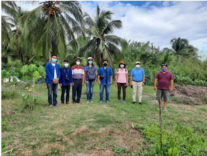
ภาพที่ 4 การสร้างเครือข่ายการเรียนรู้และสร้างความร่วมมือหรือดำเนินการในพื้นที่จริง