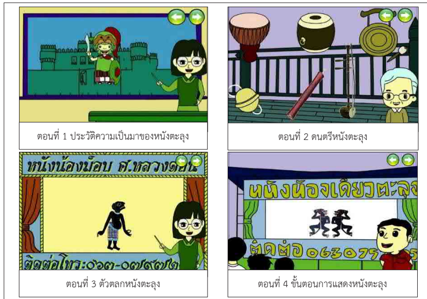
ภาพที่ 2: สื่อการเรียนการสอนหนังตะลุง

4.1.2 ผลการประเมินคุณภาพสื่อการเรียนการสอนหนังตะลุง เป็นการประเมินคุณภาพของสื่อที่พัฒนาโดยผู้เชี่ยวชาญ มีผลการประเมินคุณภาพแสดงดังตารางที่ 1