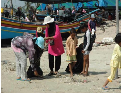
ภาพประกอบ 2 แสดงการร่วมกันเก็บขยะบริเวณชายหาดดอนทราย

ความรู้ ความเข้าใจ ให้มีบทบาทหน้าที่ ในการอนุรักษ์ การใช้ทรัพยากรอย่างคุ้มค่า และเกิดประโยชน์สูงสุด เพื่อที่เป็นการที่จะทำให้ทรัพยากรธรรมชาติกลับมา มีความอุดมสมบูรณ์ใหม่อีกครั้ง