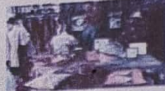
ภาพ ๒. การผลิตผลิตภัณฑ์ชุมชนท้องถิ่น

ชุมชนมีการพัฒนาผลิตภัณฑ์ชุมชนท้องถิ่น... การศึกษาการสกัดสีจากพืชธรรมชาติ