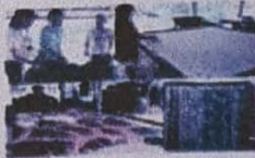
ภาพ ๓. การผลิตผลิตภัณฑ์ชุมชนท้องถิ่น

การพัฒนาผลิตภัณฑ์ชุมชนท้องถิ่น... การศึกษาการสกัดสีจากพืชธรรมชาติ