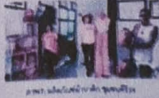
ภาพ ๔. การผลิตผลิตภัณฑ์ชุมชนท้องถิ่น

การพัฒนาผลิตภัณฑ์ชุมชนท้องถิ่น... การศึกษาการสกัดสีจากพืชธรรมชาติ