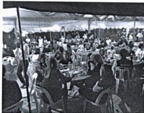
ภาพที่ 2 การเข้าร่วมงานในชุมชน โดยสามารถรับประทานอาหารร่วมกันได้