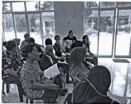
ภาพที่ 4 การเข้าร่วมแสดงความคิดเห็นร่วมกันของคนในชุมชนโดยไม่แบ่งแยกศาสนา