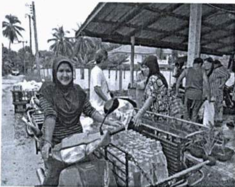
ภาพที่ 1 การมีน้ำใจเสียสละมอบของช่วยงานเอื้อเฟื้อกันของคนในชุมชน

2.2 ปัญหาด้านความเข้มข้นในการนับถือศาสนา พบว่า ปัจจุบันไม่ค่อยใส่ใจกับเรื่องศาสนา มากกว่าคนเมื่อก่อน โดยส่วนใหญ่ทุกคนให้ความสำคัญกับการนับถือพระเจ้าของแต่ละคน โดยมีการสืบทอดกันมาจนถึงในยุคปัจจุบัน และอนุรักษ์สิ่งที่บรรพบุรุษที่สืบทอดต่อกันมาก อาจจะมีในเรื่องของประเพณีบางสิ่งบางอย่างที่หายไปบ้างเล็กน้อย ซึ่งเป็นเรื่องใหญ่พุทธศาสนิกชนต้องให้ความสำคัญ แต่ส่วนใหญ่เรามักจะมองในมุมมองที่แคบไม่เห็นปัญหาในภาพรวม ปัญหาต่าง ๆ จึงไปตกอยู่ที่วัด หรือพระสงฆ์ทั้ง ๆ ที่ปัญหาเหล่านั้น ทุกคนต้องมีส่วนร่วมในการรับผิดชอบ