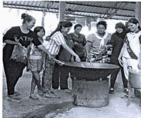
ภาพที่ 5 การร่วมแปรรูปผลผลิตภายในชุมชนร่วมกันอย่างสันติสุขไทยพุทธ-มุสลิม

2.3 ปัญหาความสมบูรณ์ของพื้นที่ที่ทำกิน พบว่า การที่มีโรงงานได้สร้างขึ้นมามากมาย จะเป็นอุตสาหกรรม เมืองแร่ หรือว่าจะเป็นในเรื่องของการขุดคูน้ำไหล มีผลกระทบต่อการประกอบอาชีพ ธรรมชาติมีความลดลง หรือเหลือน้อยเกิด เพื่อที่จะมองแต่ด้านเศรษฐกิจ ไม่ได้มองในสิ่งที่ เป็นระบบนิเวศ เห็นแก่ประโยชน์ส่วนตัวกันมากขึ้น ซึ่งสอดคล้องกับการศึกษาของแอกรินทร์ สีมหาศาล (2552 : 10-17) เรื่อง ปัจจัยที่ทำให้เกิดการอพยพถิ่นฐาน ให้นิยามว่า ความเจริญก้าวหน้าของชุมชน ทำให้เกิดการอพยพย้ายถิ่นฐานของประชากรในเขตพื้นที่ ทำให้คนในชุมชนพบเจอแต่ความลำบากมาก เพราะอย่างน้อยต้องพาตัวเอง และครอบครัวให้มีการดำรงชีวิตที่อยู่รอด