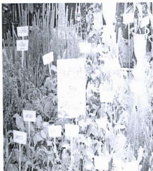
ภาพที่ 3 บอกราคาพริกผัดสวนครัว