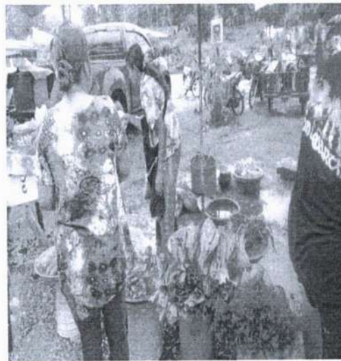
ภาพที่ 2 การซื้อขายระหว่างลูกค้ากับผู้ชาย