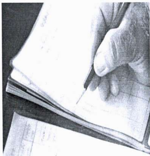
ภาพที่ 1 สมุดบัญชีรายรับรายจ่าย

เครื่องมือหลาย ๆ อย่างรวมกัน ซึ่งเรียกว่า ส่วนประสมการส่งเสริมการตลาด (promotion mix) ซึ่งประกอบด้วย เครื่องมือสื่อสาร