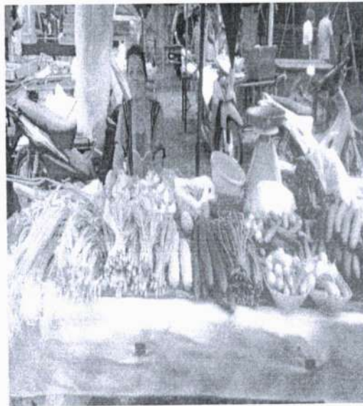
ภาพที่ 4 พริกผัดหลากหลายชนิด