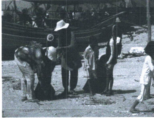
ภาพประกอบ 2 แสดงการร่วมกันเก็บขยะบริเวณชายหาดดอนทราย

ความรู้ ความเข้าใจ ให้มีบทบาทหน้าที่ ในการอนุรักษ์ การใช้ทรัพยากรอย่างคุ้มค่า และเกิดประโยชน์สูงสุด เพื่อที่เป็นการที่จะทำให้ทรัพยากรธรรมชาติกลับมา มีความอุดมสมบูรณ์ใหม่อีกครั้ง