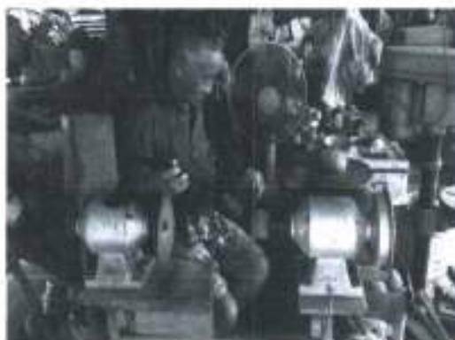
ภาพประกอบ 1 แสดงกระบวนการแปรรูปผลิตภัณฑ์จากกะลามะพร้าว

สุภาพสตรี ของชำร่วย และเป็นของฝากของที่ระลึก ขึ้นอยู่กับคุณสมบัติของการใช้งานแต่ละประเภท