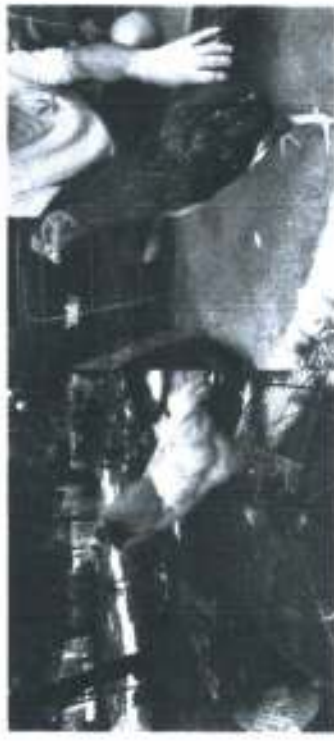
ภาพประกอบ 5 แสดง ไก่ชนสีเหลืองทางขวา ภาพประกอบ 6 แสดงไก่ ชนสีประตูทางซ้าย

พัฒนาได้...ได้พัฒนา...ฝึกกระแทกสังคม เศรษฐกิจและการเมืองโลก