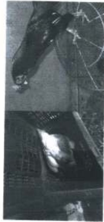
ภาพประกอบ 3 แสดง การฝึกไข่ ภาพประกอบ 4 แสดง ไก่ชนสีกรด

พัฒนาได้...ได้พัฒนา...ฝึกกระแทกสังคม เศรษฐกิจและการเมืองโลก