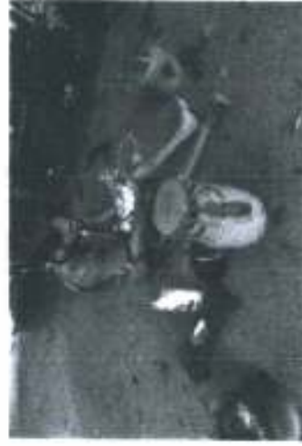
ภาพประกอบ 9 แสดงการประสบด้วยกรรมร้อน และใช้ฆนทา

ปัญหาในการเลี้ยงไก่ชนเพื่อการแข่งขัน กรณีศึกษา : ชุมชนกฤษ ชุมชนคลองเมียด ตำบลหนองสรวง อำเภอกงหรา จังหวัด นครศรีธรรมราช