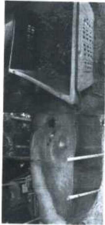
ภาพประกอบ 1 แสดง พ่อพันธุ์-แม่พันธุ์เขาน การรองรับ

พัฒนาได้...ได้พัฒนา...ฝึกกระแทกสังคม เศรษฐกิจและการเมืองโลก