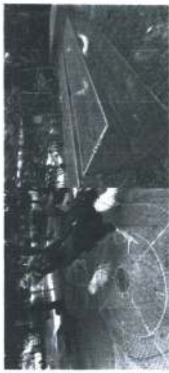
ภาพประกอบ 7 แสดงไก่ ชนสีประตูทางซ้าย ภาพประกอบ 8 แสดงการ ปล่อยไก่ชนออกกำลังกาย