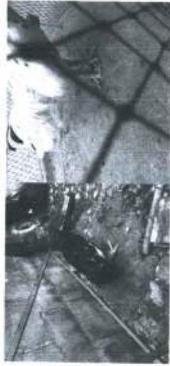
ภาพประกอบ 10 แสดง ตัวอย่างไก่ที่ป่วยเนื่องจากโรคผสมเลือดชิดทำให้ไก่ไม่สมบูรณ์

4. ปัญหาการผสมเลือดชิดพบว่า การผสมแบบเลือดชิด (Inbreeding) ระหว่างไก่ที่มีความสัมพันธ์ทางสายเลือดเดียวกัน จะเกิดความเสียหายต่าง ๆ คือ สมรรถภาพในการผลิตต่าง ๆ ลดลง เช่น ความแข็งแรงลดลง อัตราการผสมลดจำนวนลูกต่อตัว และความสมบูรณ์ต่ำลง การเจริญเติบโตลดลง ลักษณะไก่ เช่น ปากหงวี่ นีเมา ปีกสองตอน ออกคด หลังค่อมเป็นไก่ ขี้โรค การผสมแบบเลือดชิดส่งผลให้ไก่ก่อนแอ่ เป่าวง่าย ตายง่าย ส่วนใหญ่การผสมไก่จะผสมแค่รุ่นสองรุ่นเท่านั้น แล้วเปลี่ยนสายใหม่