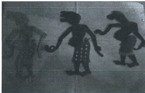
ภาพประกอบ 1 แสดงตัวหนังตะลุง

3. ประเภทของผลิตภัณฑ์หนังตะลุง พบว่า รูปแบบของผลิตภัณฑ์หนังตะลุง คือ การแกะหนังตะลุงของกลุ่มวิสาหกิจชุมชนแกะหนังตะลุงที่ทางกลุ่มได้ทำขึ้น ก็จะมีการแกะรูปตัวหนังตะลุงทุกขนาด ภาพติดฝาผนังหลายรูปแบบไม่ว่าจะเป็นภาพรามเกียรติ์ ภาพธรรมชาติ แบบพวงกุญแจ ซึ่งส่วนใหญ่จะสั่งซื้อนำไปเป็นของที่ระลึก