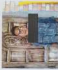
ภาพประกอบที่ 6 ม้าทรงตะวันตก