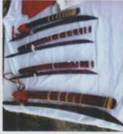
ภาพที่ 9 ดาบของบวริวารทวดกลายใช้ในการอันเชิญ