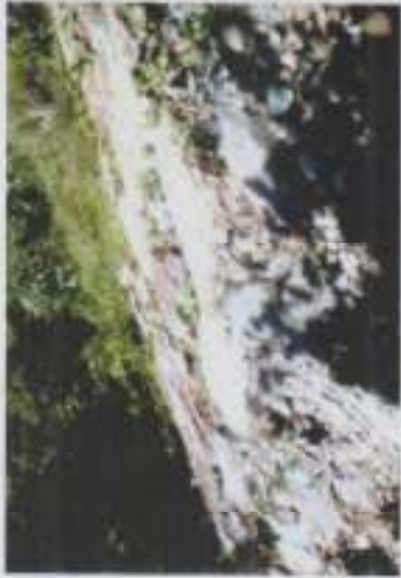
ภาพที่ 13 ริมตลิ่งข้างศาลาหวดกลายที่พังและได้รับการซ่อมแซมแล้ว