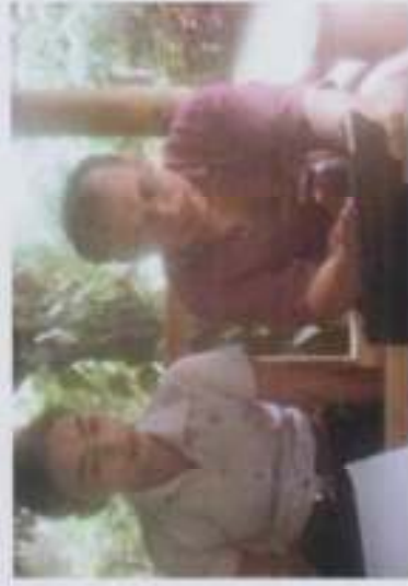
ภาพที่ 20 การให้ความรู้ถึงชุมชน และประวัติศาสตร์ชุมชนเพื่อส่งเสริมการ วิจัยด้านอนุรักษ์แหล่งน้ำ