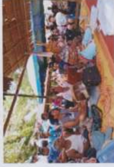
ภาพที่ 11 มิโนบราห์เชื้อกำลังว่าบทกลอนเชื้อ