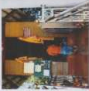
ภาพที่ 4 การเข้ามาบนบานของชาวบ้าน ทั้งในชุมชน และนอกชุมชน.