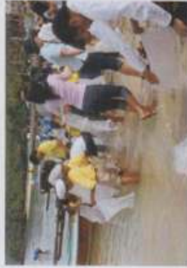
ภาพที่ 18 คนในชุมชน ภาครัฐ และเอกชน ร่วมกันดูแล และจัดการขยะรอบ คลองกลาย

บริหารจัดการระบบชุมชน ผู้คุณภาพการจัดการศึกษา และเป็นแหล่งสร้างเสริม ประสบการณ์การเรียนรู้ของผู้เรียนอย่างมีคุณภาพ