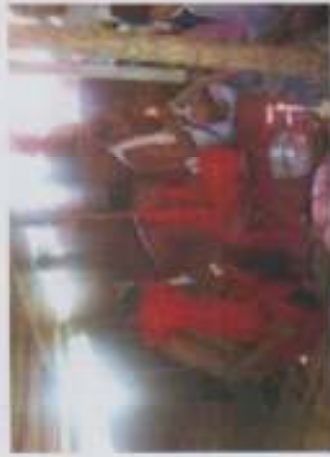
ภาพที่ 8 บวริวารทวดกลายเพื่อการอันเชิญทวดกลายประทับทรง

"การอันเชิญทวดกลายนั้นอุปกรณ์ต่าง ๆ ต้องครบ เช่น เครื่องบ่วงหมี่ ดาบ บายศรี สิ่งเหล่านี้เป็นสิ่งที่ไม่ได้ใบกร่างทำพิธี เพราะถ้าขาดสิ่งใดสิ่งหนึ่ง พิธีก็จะไม่เกิด การเรียกทวดกลายก็จะไม่มาตามคำเรียก "ใหญ่ แบน ชำคน, สัมภาษณ์วันที่ 19 สิงหาคม 2559) ทั้งนี้ "... จะยึดถือใบราห์เป็นหลัก... เสียงก้อง เสียงของใบราห์ที่เชื่อ ต้องเสียงดัง มือได้ว่าเป็นวันที่มีลูกหลานจะได้พบประมุขคุณงามเรื่องราวต่าง ๆ ที่ทุกคนอยากจะถาม..." (สุธรรม ชำคน, สัมภาษณ์วันที่ 19 สิงหาคม 2559) แต่ในการอันเชิญทวดกลายประทับทรงนั้น ต้องมีบายศรี ไข่เจียว ไบรา ดาบ และเครื่องบ่วงหมี่ สิ่งเหล่านี้ขาดไม่ได้ในการอันเชิญทวดกลายประทับทรง เพื่อเป็นการสักการะทวดกลาย และบวริวารที่มาประทับทรง