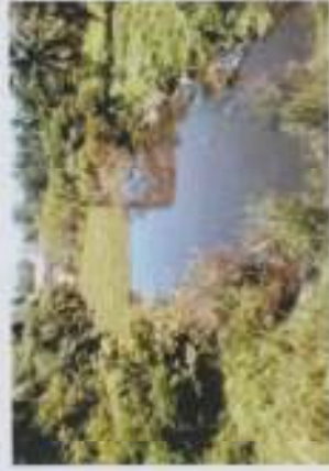
ภาพที่ 12 ทรัพยากรลุ่มน้ำคลองกลาย

ผลการศึกษาพบว่า การสร้างชุมชนให้เข้มแข็งด้วยการ ร่วมกันในการตั้งกฎของชุมชน และให้ชาวบ้านมีส่วนร่วมในทุก ๆ เรื่องที่ เกี่ยวข้องกับชุมชน โดยส่วนมากคนในชุมชนจะช่วยดูแล และสอดส่องความ เป็นอยู่ของชุมชน เพราะหากว่าเราแล้วแต่ระบบข้าราชการนั้นมาดูแลในส่วน ของชุมชนก็จะไม่มีอะไรที่ดีกับชุมชน เพราะเขาทำอะไรไม่ค่อยดีเพียงผลของ ประชาชน