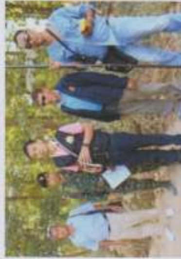
ภาพที่ 19 หน่วยงานของรัฐ องค์การปกครองส่วนท้องถิ่น และประชาชน ร่วมกันเฝ้าระวังพื้นที่รอบคลองกลาย