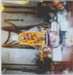
ภาพที่ 3 คุณลักษณะรูปร่างหน้าตาของทวดกลาย