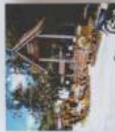
ภาพที่ 1 ศาลาทวดกลาง

ทั้งนี้เพราะเรื่องเล่า และประวัติของทวดกลางนั้นมีการเล่า ต่อ ๆ กันมา ว่ามีภูตของการอาศัยริมแม่น้ำคลองกลายนั้น คือ อย่างนำหนู และ มุ่งลงไปซึกล้างในส้วมวัดของกลาย หรือต่อหลายรุ่น และยังคงมีการสืบสาน การเชื่อทวดกลาย และมักทรงองค์อื่น ๆ ขึ้นทุกปี ก็ได้ว่า เป็นงานประจำปีของ ชาวบ้าน ส่วนลสรระแก้วที่จัดขึ้นทุกปี ณ ศาลาทวดกลายเพราะในแต่ละปี แล้นแต่ช่างไททวดกลายนั้น จะแปรร่างเป็นงูจงอางตัวใหญ่ขึ้นมานอนอยู่ที่ กลางสวนมะพร้าว เพื่อแสดงให้ดูหลานเห็น ว่า ท่านยังคงดูแลทุกคนอยู่ ตลอดเวลา