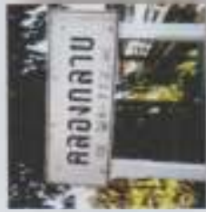
ภาพที่ 2 ป้ายอาณาเขตดั้งเดิมของกลาย