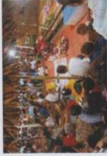
ภาพที่ 10 การว่าบทกลอนเชื้อทวดทวด

"มิโนบราห์เชื้อ เป็นผู้ที่คอยเรียกทวดทวด และบรรพชน เวลาที่มีการทำบุญอุทิศและเวลา งานเชื้อ ทวดทวด การที่มิโนบราห์เชื้อจัดได้ว่าพิธี นี้ ถือเป็นพิธีที่ศักดิ์สิทธิ์ และเป็นพิธีใหญ่ที่มี ความสำคัญเป็นอย่างยิ่ง" (เคล็น พันชนะ, สัมภาษณ์วันที่ 19 สิงหาคม 2559) ในขณะที่ "... ผู้ที่คอยเรียกเชิญทวดทวดในวันเชื้อเชิญทวด ทวด... เพราะหากไม่เรียกตามธรรมเนียมทวด ทวดก็จะไม่มาประทับทรง" (บริษา จำคม, สัมภาษณ์วันที่ 19 สิงหาคม 2559)