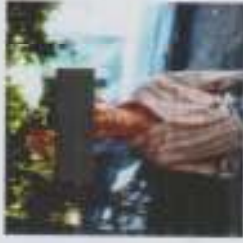
ภาพประกอบที่ 5 ม้าทรงทวดกลายตะวันตก

ทั้งนี้บริวารของทวดกลายทุกคนนั้นจะมารวมกันก็ต่อเมื่อวันทำบุญรอบปี และวันทำพิธีเซ่นเซียง หรือหากมีพรเรื่องดีใหม่ในวันนั้น ๆ แต่หากทวดกลายไม่สามารถมาประพรมน้ำพรก็ได้ ก็จะให้พรทางดารามาแทน