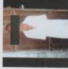
ภาพประกอบที่ 7 ม้าทรงพื้นเจ้าเพชร