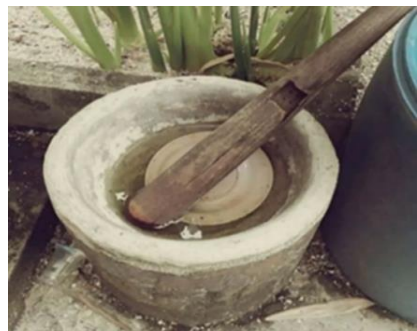
ภาพที่ 3 แสดงครก , สาก ในการตำกุ้งเคย