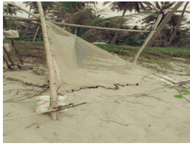
ภาพที่ 1 แสดงอวนโพงพางที่ใช้โช้วถ่วงเป็นเครื่องมือในการจับกุ้งเคย