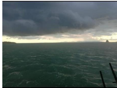
ภาพที่ 7 แสดงการสภาพพ่นฟ้าอากาศทางท้องทะเล

3. แนวทางส่งเสริมด้านการแปรรูปกุ้งเคยเพื่อส่งเสริมเศรษฐกิจชุมชน กรณีศึกษา : ชุมชนบ้านพังปริง หมู่ที่1 ตำบลกลาย อำเภอบ้านลาด จังหวัดนครศรีธรรมราช พบว่า