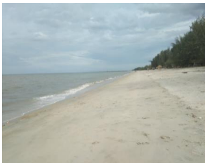
ภาพที่ 2 แสดงชายหาดเป็นพื้นที่จับกุ้งเคย