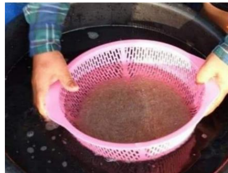
ภาพที่ 5 แสดงการล้างกุ้งเคยให้สะอาดโดยการเลือกสิ่งแปลกปลอมออก

2. สภาพปัญหาในการแปรรูปกุ้งเคยเพื่อส่งเสริมเศรษฐกิจชุมชน กรณีศึกษา : ชุมชนบ้านพังปริง หมู่ที่ 1 ตำบลกลาย อำเภอบ้านลาด จังหวัดนครศรีธรรมราช พบว่า