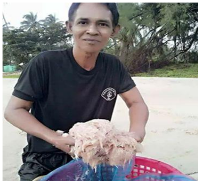
ภาพที่ 4 แสดงเลือกสิ่งแปลกปลอมออกจากกุ้งเคย