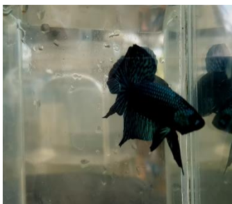
ภาพที่ 1 พ่อพันธุ์ปลากัด

1.1 เทียบคู่ การเทียบคู่จำเป็นสำหรับการเพาะปลา คือปลาทั้งตัวผู้และตัวเมียจะได้มีความคุ้นเคยกันช่วยลดความรุนแรงลงได้ส่วนหนึ่ง อีกทั้งแม่ปลาที่สมบูรณ์และมีไข่ ในท้องก็เริ่มตื่นตัวและมีการเร่งไข่เหล่า นั้นให้สุกงอมเต็มที่ และยอมให้ตัวผู้รัดด้วยความสมัครใจ การเทียบปลาไม่มีอะไรมากนัก เพียงแต่ นำพ่อพันธุ์และแม่พันธุ์ใส่โหลคนละใบมาวางเทียบ กันโดยไม่มีอะไรมาก ขวางกัน ให้ปลาทั้งคู่มองเห็นกันเท่านั้น ในขั้นตอนการเทียบคู่นี้ควรใช้การ สังเกตหลายสิ่งถึงความพร้อม ในการผสมพันธุ์ โดยให้คอยสังเกตพ่อปลาว่าเมื่อได้มีการเริ่มต้น เทียบปลา พ่อปลามีความคึกคักที่ให้เห็นตัวเมีย ในไม่ช้าพ่อปลาจะเริ่มก่อหวอด ส่วนแม่พันธุ์ให้ สังเกตไข่หน้าที่ได้ท้องว่ามีลักษณะยื่นออกมา มีท้องที่อูมเป่ง เมื่อเวลาพ่อปลาแสดงลีลารักเข้าหา แม่ปลาจะว่ายเข้าหาในทันทีและว่ายในลักษณะที่มึนหัวเข้าหา แสดงสีเป็นแนวขวางตามลำตัว เห็นได้ชัดเจน มีเท่านั้นหละครับแสดงว่าทั้งสองฝ่ายได้ตกลงปรองใจได้เสียกันแล้ว เทคนิคในการ เทียบคู่เป็นเทคนิคของนักเพาะแต่ละคนโดยไม่มีกรวางไว้ตายตัว แล้วแต่เทคนิคของแต่ละคน