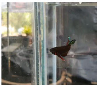
ภาพที่ 2 แม่พันธุ์ปลากัด