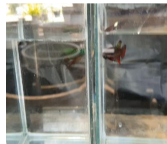
ภาพที่ 3 การเทียบคู่ปลากัด

1.2 เตรียมอุปกรณ์ การเตรียมอุปกรณ์ในการผสมพันธุ์ปลากัด ได้แก่ กะละมัง โหล แก้ว ลังโฟม บ่อซีเมนต์ เตรียมใส่น้ำในบ่อทิ้งไว้สัก 1-2 วัน เพื่อปรับสภาพน้ำ เตรียมฝาปิด