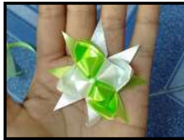
ภาพที่ 4 การทำแบบสำเร็จ

สภาพปัญหาอาชีพการทำเหรียญโปรยทานแบบสวยงามๆ พบว่า ชุมชนบ้านห้วยดินดานพบเจอสภาพปัญหา มี 2 ด้าน ได้แก่ 1) ด้านความชำนาญในการพับเหรียญโปรยทาน ปัญหาความไม่ชำนาญในการพับเหรียญโปรยทาน ทำให้ส่งผลต่อลูกค้าได้รับของล่าช้า และเหรียญโปรยทานอาจออกมาไม่สวยงามตามที่ลูกค้าต้องการเพราะขาดความชำนาญในการทำ จึงต้องฝึกทำบ่อย ๆ และ 2) ) ด้านการส่งเสริมด้านการตลาดและการประชาสัมพันธ์ เกิดจากการไม่มีการประชาสัมพันธ์ที่ชัดเจนในเรื่องของสถานที่ทำเหรียญโปรยทาน และการราคาที่น่าพอใจเกินไปเมื่อลูกค้าไปซื้อผ่านแม่ค้าคนกลางและการบรรลุผลผลิตภัณท์ยังไม่เป็นที่ดึงดูดคนซื้อ