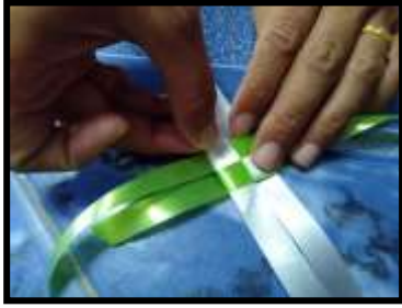
ภาพที่ 1 การพับและการวางเหรียญ