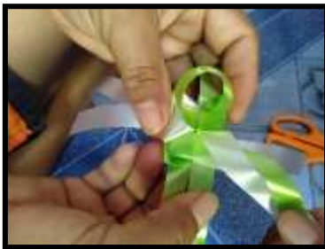
ภาพที่ 3 การทำกลีบดอกบัวชั้นใน