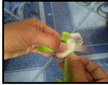
ภาพที่ 2 การทำกลีบดอกบัวชั้นนอก