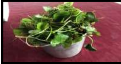
ภาพที่ 1 ใบบวบที่ใช้ในการผลิตน้ำมันบวบ

โดยการรับสมาชิกเพิ่มขึ้นมีการติดต่อประสานงานกับกลุ่มจากภายนอก เพื่อนำสินค้าไปขาย หรือเพื่อหาวัตถุดิบในการผลิตต่อไป