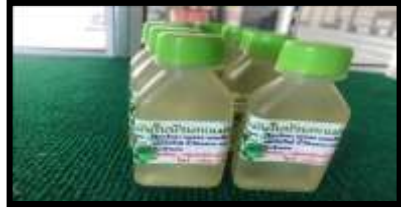
ภาพที่ 2 น้ำมันบวบ

สภาพปัญหาของกลุ่มอาชีพเพื่อธุรกิจชุมชน พบว่า มี 4 ด้าน ได้แก่ 1) ด้านการผลิต ทางกลุ่มมีปัญหาในด้านการผลิต เนื่องจากเครื่องมือที่ใช้ไม่มีความทันสมัย ขาดงบประมาณ ทำให้ผลิตออกมาช้า นอกจากนี้แล้วยังมีปัญหาเกี่ยวกับวัตถุดิบ ซึ่งในบางช่วงขาดแคลนวัตถุดิบที่ใช้ในการผลิต ทำให้ต้องซื้อวัตถุดิบมาจากภายนอกชุมชน 2) ด้านบรรจุภัณฑ์ ยังไม่สวยงาม รูปทรงไม่ทันสมัย ฉลากไม่สวยงาม ทางกลุ่มมีแนวคิดที่จะเปลี่ยนบรรจุภัณฑ์รูปแบบใหม่ ให้เป็นขวดพลาสติกใส แล้วติดฉลากบรรจุภัณฑ์ ระบุวันเดือนปีผลิต สถานที่ผลิต และสรรพคุณ ภาพของน้ำมันใบบวบให้ครบถ้วน 3) ด้านการส่งเสริมการตลาด เป็นการส่งเสริมการขายที่มุ่งสู่ผู้บริโภค เพื่อจูงใจให้เกิดการซื้อจำนวนมากขึ้น ตัดสินใจซื้อได้รวดเร็วหรือเกิดความต้องการที่จะทดลองใช้สินค้า เช่น การโฆษณา การประชาสัมพันธ์ โปรโมชัน และ 4) ด้านการตลาด ยังมีตลาดรองรับที่ไม่แน่นอน กลุ่มผู้ผลิตเป็นเพียงกลุ่มเล็ก ๆ ยังไม่ที่รู้จักอย่างแพร่หลาย