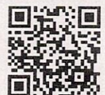
QR-Code เพื่อจองห้องพัก

โทรศัพท์: ๐๒-๔๒๒-๙๒๒๒ E-mail : rsvn@royalriverhotel.com