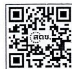
หลักเกณฑ์การประเมินเว็บไซต์