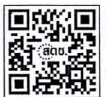
แบบตอบรับ