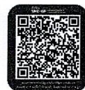
QR Code แบบสำรวจ