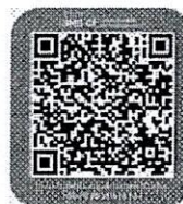
QR Code แบบตอบรับ