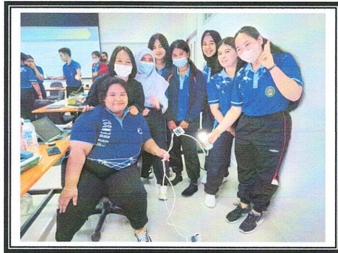
ภาพที่2 การทดสอบอุปกรณ์ไฟฟ้าภายในอาคาร