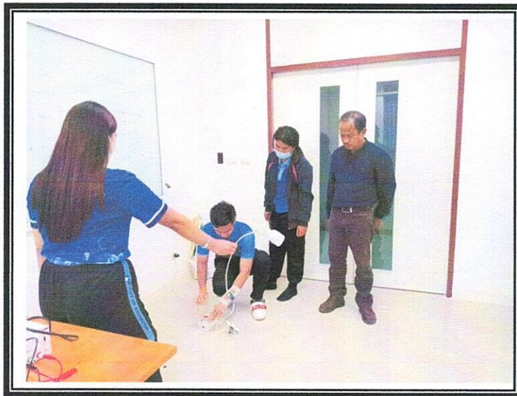
ภาพที่3 การทดสอบอุปกรณ์ไฟฟ้าภายในอาคาร