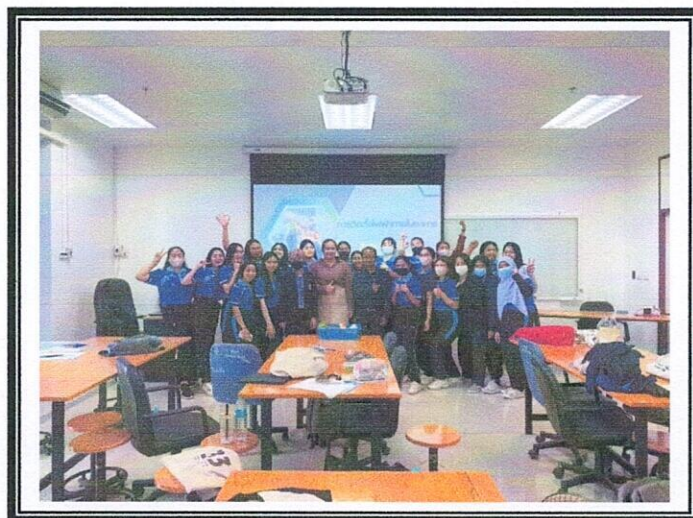
ภาพที่1. บรรยากาศผู้เข้าร่วมอบรม

ภาพกิจกรรม (หมายเหตุ ไม่เกิน 6 รูป พร้อมแนบไฟล์ JPEG Image ด้วย)