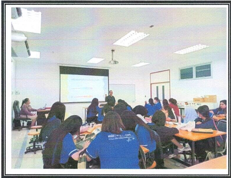
ภาพที่4 การอบรมกิจกรรมการพัฒนางานช่างฟิสิกส์ “ระบบไฟฟ้าในอาคาร”