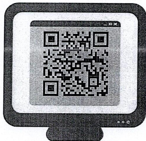
Poster ประชาสัมพันธ์