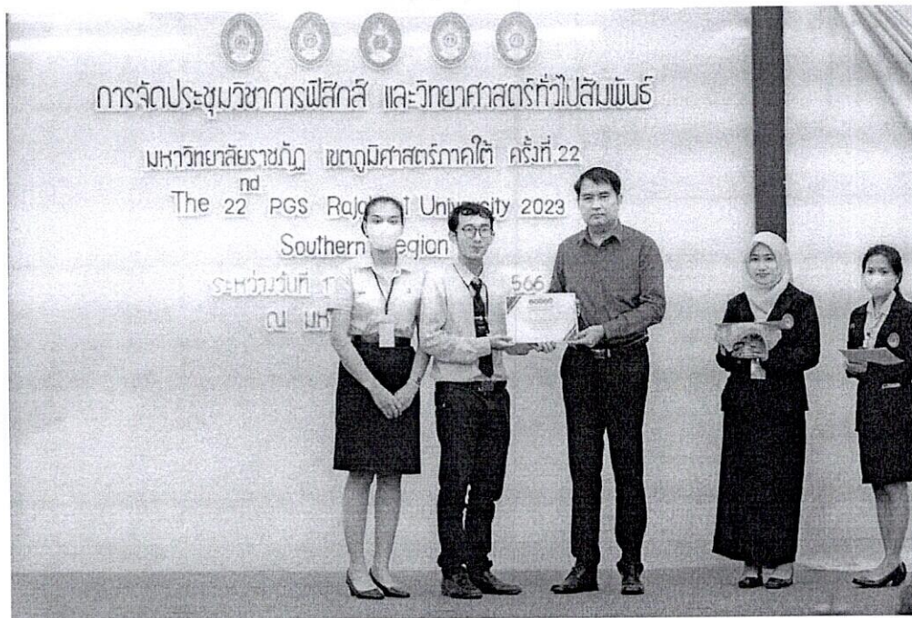
นักศึกษาชั้นปีที่ 4 ที่ได้รับรางวัลการนำเสนอผลงานวิจัย Oral Presentation "ระดับดี".