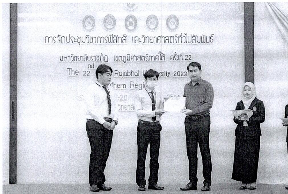
นักศึกษาชั้นปีที่ 4 ที่ได้รับรางวัลการนำเสนอผลงานวิจัย Oral Presentation "ระดับดี"