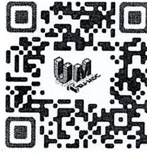
QR Code แบบฟอร์มการสมัคร

- สามารถติดต่อสอบถามข้อมูลเพิ่มเติมได้ที่