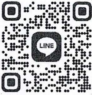
QR Code กลุ่ม Line