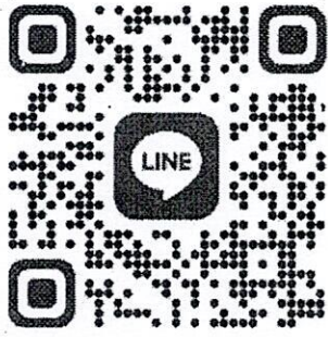
QR Code กลุ่ม Line