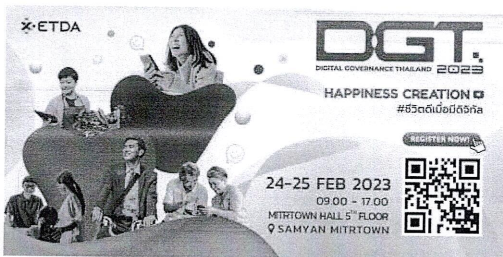
ตัวอย่าง Banner

https://dgt.etda.or.th เว็บไซต์งาน DGT2023