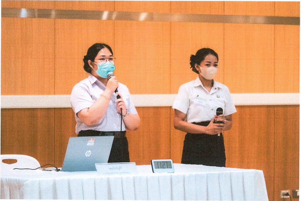
รูปที่ 1 ทีมที่ 1 นำเสนอชิ้นงานรอบชิงชนะเลิศ

ภาพกิจกรรม (หมายเหตุ ไม่เกิน 6 รูป พร้อมแนบไฟล์ JPEG Image ด้วย)