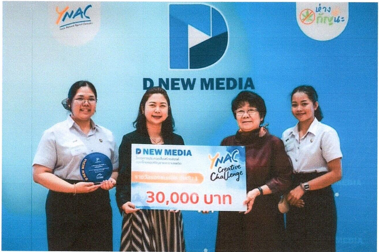
รูปที่ 3 รับรางวัลรองชนะเลิศอันดับที่ 1