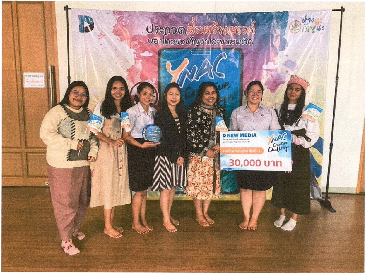
รูปที่ 4 ทีมที่ 1 และ 2 ถ่ายภาพรวมกัน