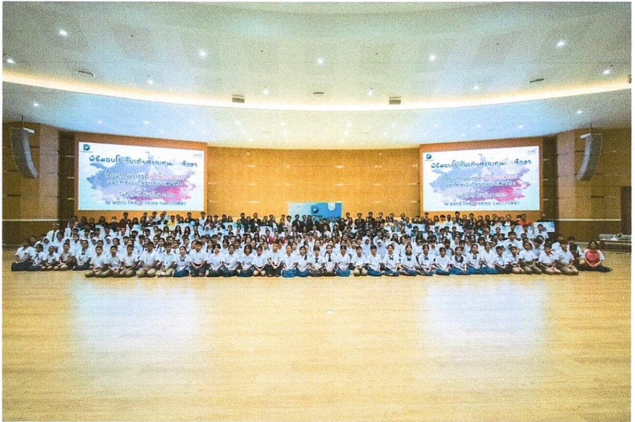
รูปที่ 5 จำนวนผู้ที่ผ่านเข้ารอบชิงชนะเลิศทั้งหมด