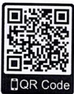
สิ่งที่ส่งมาด้วย ๑

จึงเรียนมาเพื่อโปรดพิจารณาและขอขอบพระคุณล่วงหน้ามา ณ โอกาสนี้