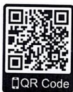
สิ่งที่ส่งมาด้วย ๕