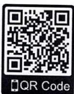
สิ่งที่ส่งมาด้วย ๓