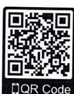
สิ่งที่ส่งมาด้วย ๔