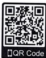
สิ่งที่ส่งมาด้วย ๒