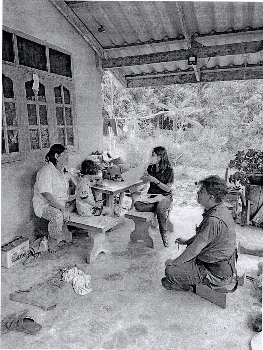
ภาพที่ 2 สัมภาษณ์ชาวบ้านชุมชนเจ้าพะที่สัมพันธ์อยู่กับกลุ่มชาติพันธุ์มานิกลุ่มคลองตง อำเภอปะเหลียน จังหวัดตรัง วันที่ 25 พ.ย.256