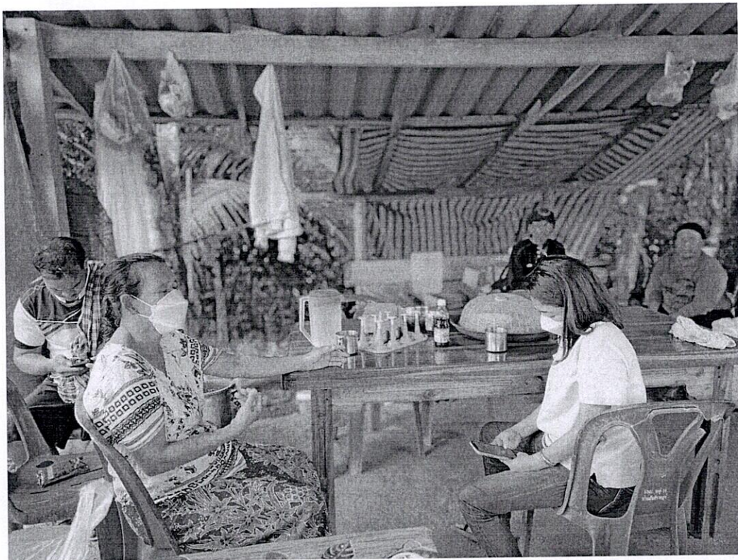
ภาพที่ 1 สัมภาษณ์ชาวบ้านเกี่ยวกับการใช้ประโยชน์จากป่าชุมชนเจ้าพะ อำเภอบะเหลียน จังหวัดตรัง วันที่ 24 พ.ย.2565